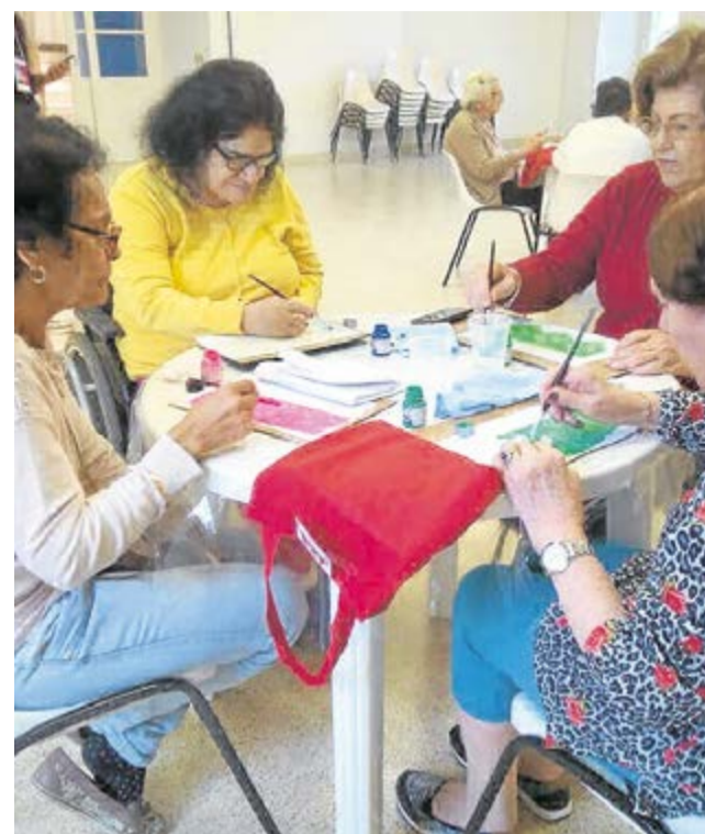
Oficina no Oásis