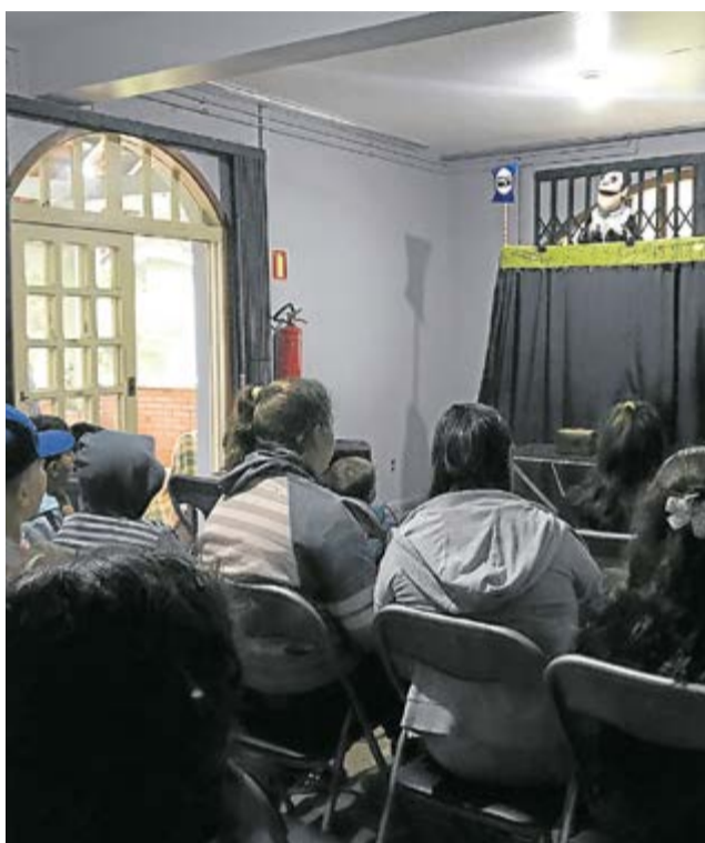
Teatro de Bonecos na Casa Lar

O evento é uma realização da Secretaria de Turismo e Cultura e produção da Beatles Brasil Entretenimento Ltda.