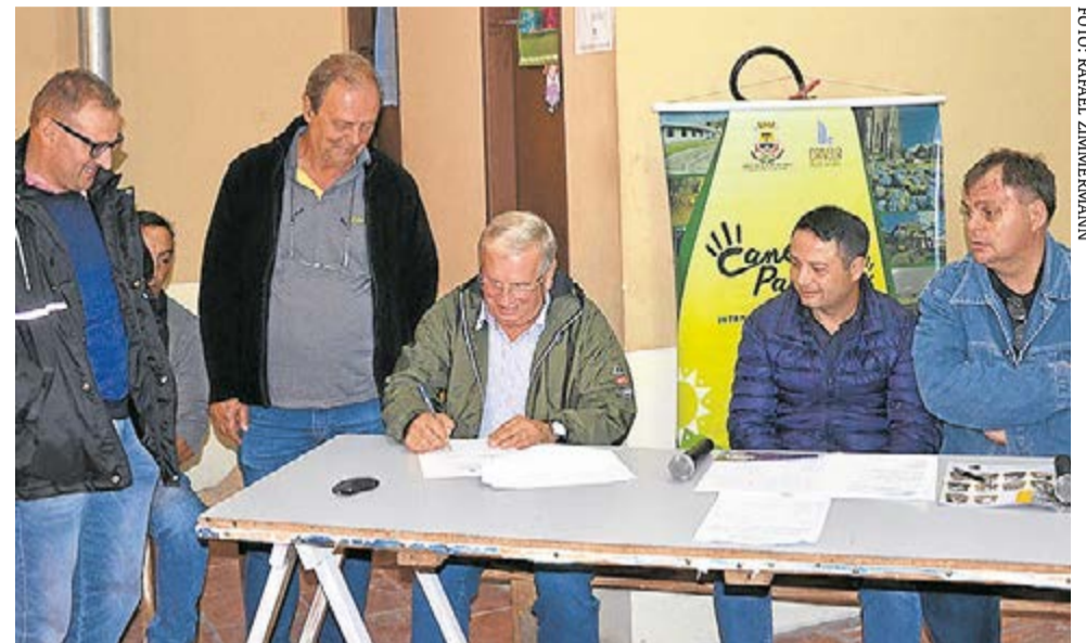
Assinatura do início das obras das ruas José Foss e Maria Seibt, no bairro São José

Ao todo o projeto contemplará o asfaltamento de 45 vias do município. O fi-