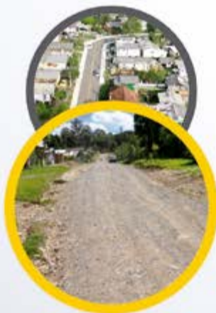
Rua Pres. Ernesto Geisel