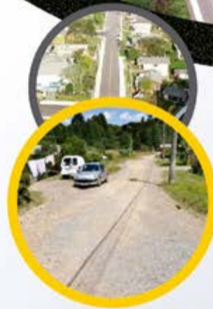
Rua Amália Optiz