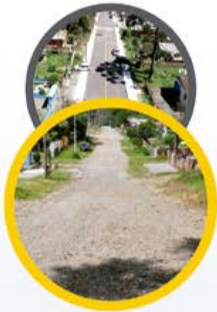
Rua Máximo Dossin