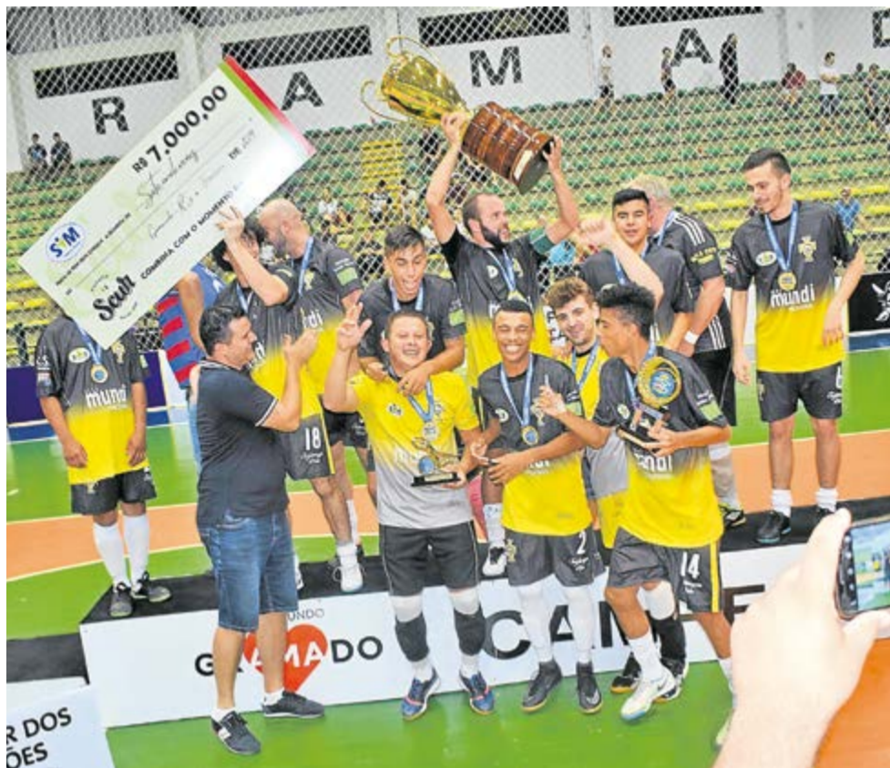
Campeão: Bola 8/Espelho Gaúcho (Canela)

A Pizzaria Scur foi a patrocinadora master da copa.