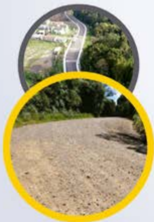
Rua Silvino Rafael Zanatta