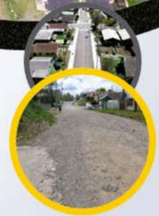
Rua Deci R. Franzen Zarth