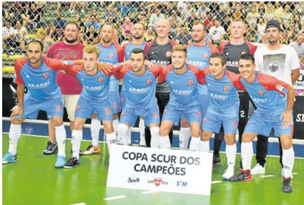
Vice-Campeão: Manchas (Nova Petrópolis)