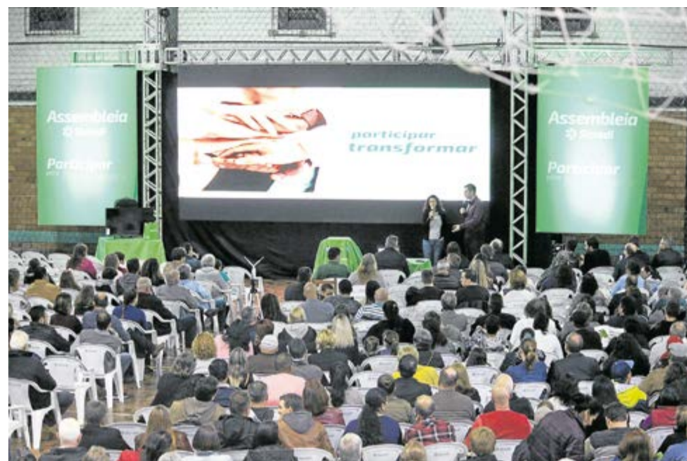
Assembleia em Canela

A Escola Municipal Zeferino José Lopes, no Morro Cal-