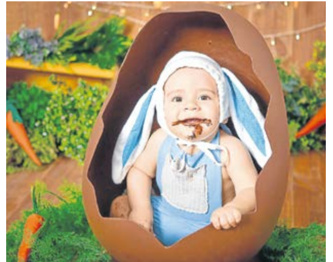
Joaquim esbanjando docuras!