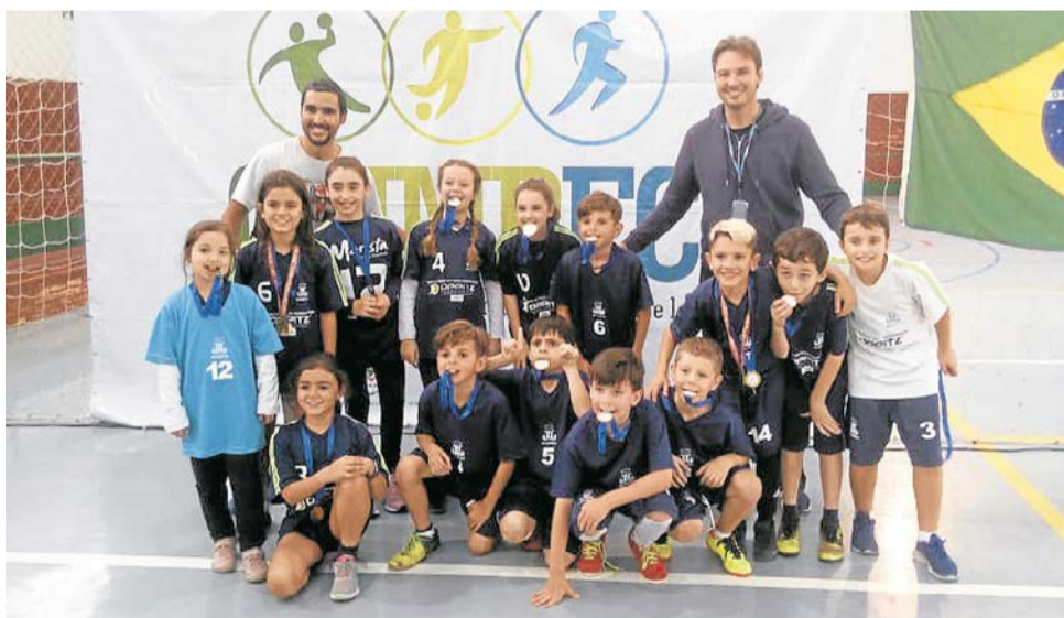
Campeões sapequinha, masculino e feminino