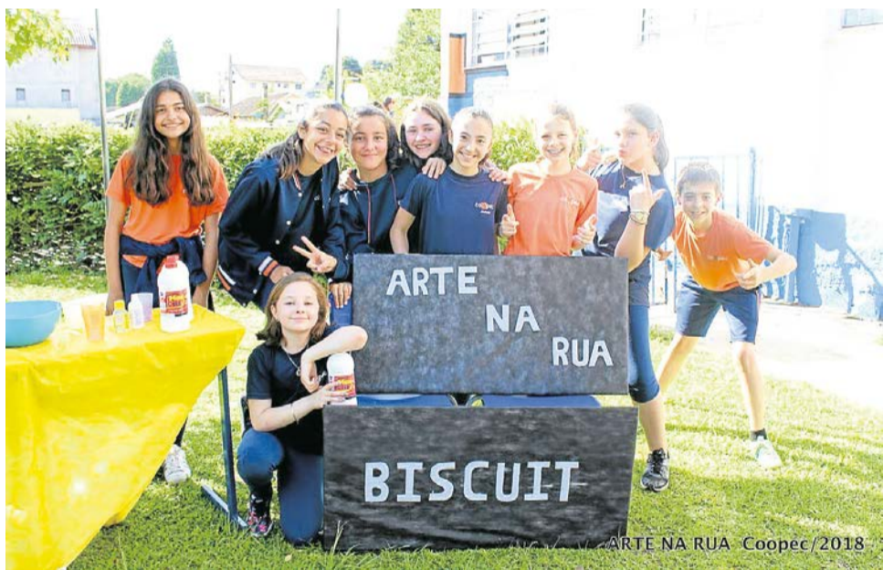
Projetos culturais são desenvolvidos na escola