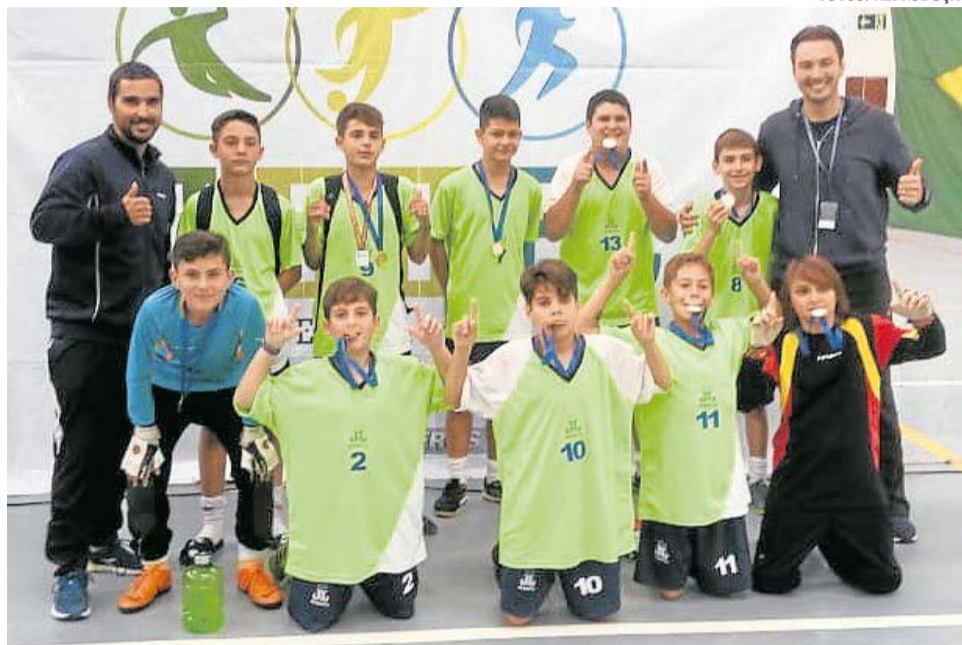
O Colégio Marista Maria Imaculada foi o campeão geral do futsal, na foto, a equipe Mirim Masculino