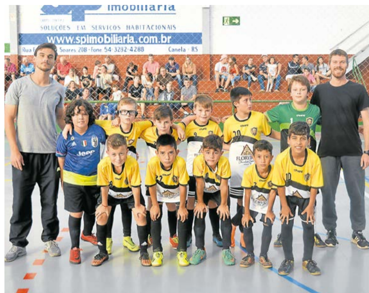
C. F. A Rico

A partida que fechou a rodada contou com a primeira vitória da equipe do C.F.A. Rico. O adversário foi o Leodoro de Azevedo "B". A