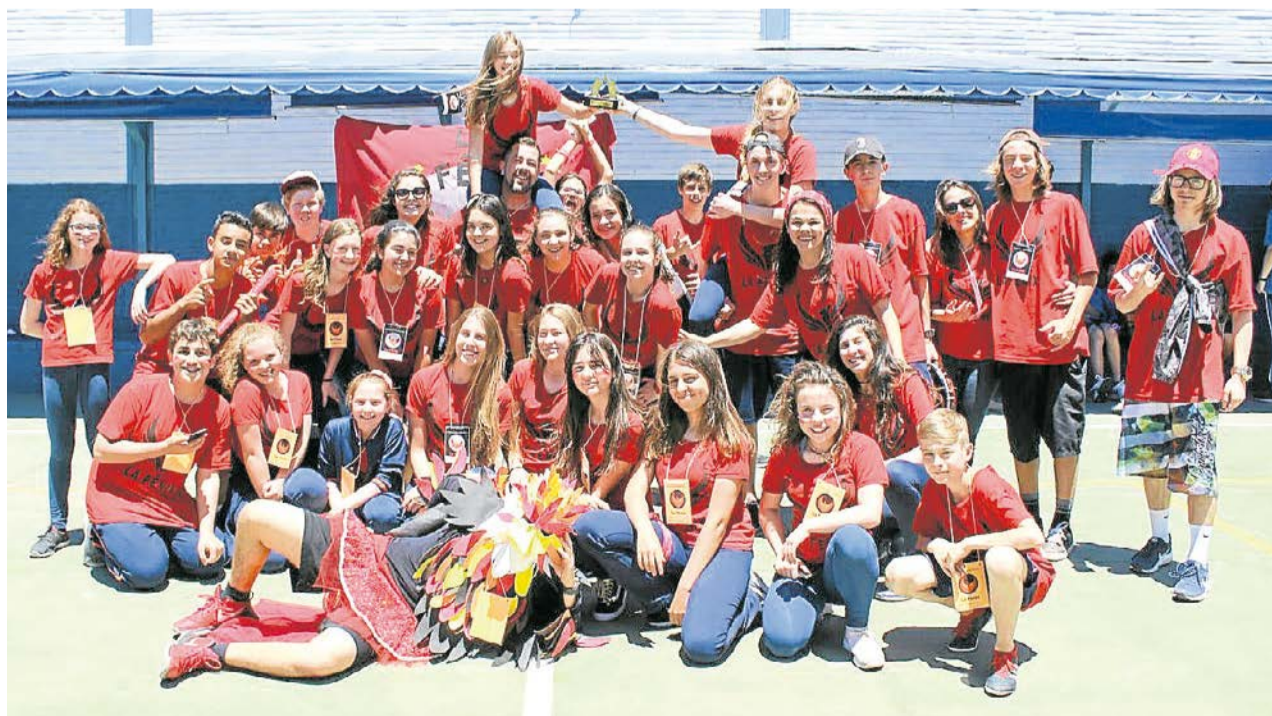
Gincana estimula a criatividade e cooperação entre os alunos

Assim é a Coopec, uma escola que nasceu do sonho e da união de um grupo de professores apaixonados pela educação, que almejavam ensinar com comprometimento, amor e cooperação sem jamais esquecer que cada aluno é um ser ÚNICO com potencial para aprender mas também ensinar sempre.