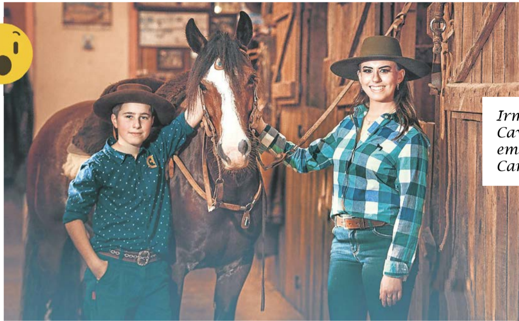
Irmãos Cavallin em Book Campeiro!