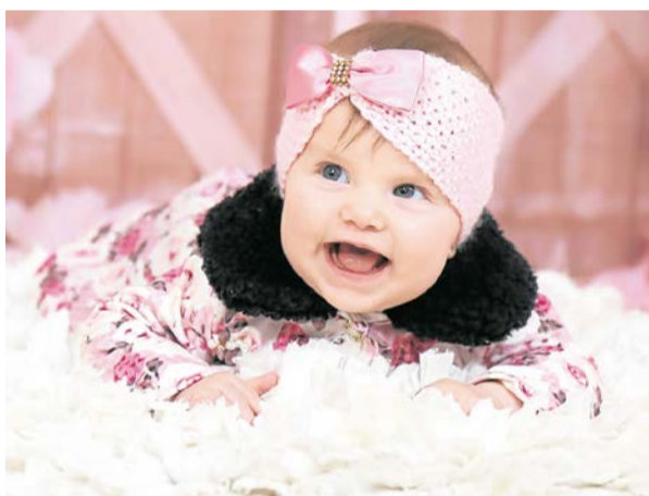
4 meses da gatinha Bethina