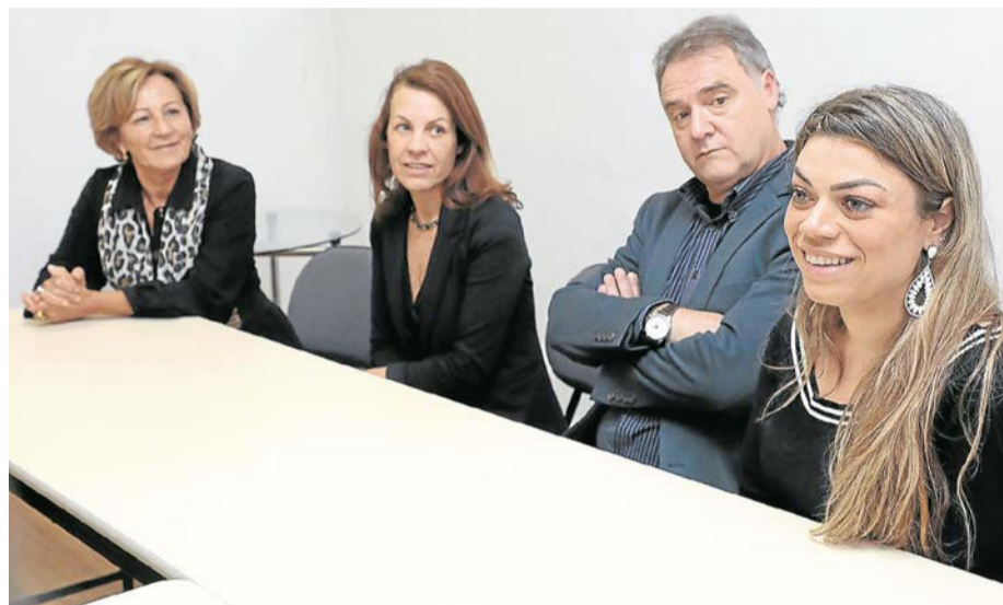
Apresentação da empresa à comunidade e imprensa

A Gramadotur deu, também, a largada para a venda dos ingressos