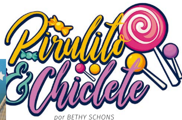
por BETHY SCHONS