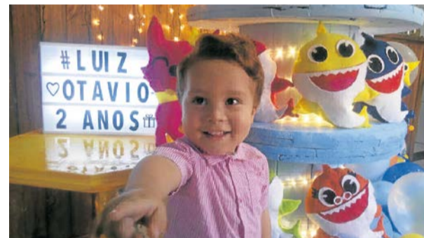
Ontem, 8 foi os 2 aninhos do gatinho Luiz Otávio. parabéns!