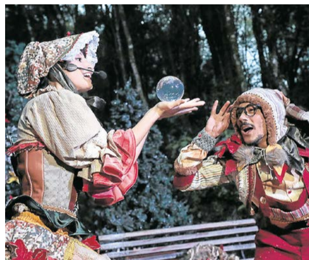
A Lenda do Bosque de Natal

A 34ª edição, que acontece de 24 de outubro a 12 de janeiro de 2020 proporcionando oportunidade de comprovar que "Aqui a Magia é Real", conta com diversas novidades, com destaque para os tradicionais três espetáculos pagos: Illumination no lago Joaquina Rita Bier, o Desfile - A Magia de Noel e a Lenda do Bosque de Natal no ExpoGramado, lembrando que todas as outras atrações do Natal