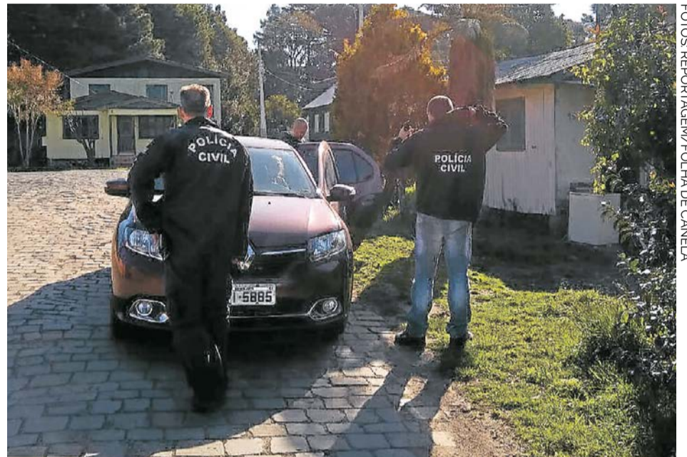
Após serem abordadas, adolescentes foram detidas pela Polícia Civil

Uma das meninas tem 13 anos e figura como vítima em um inquérito sobre abuso sexual na Delegacia de Canela, sua irmã, de 15 anos também faz par-