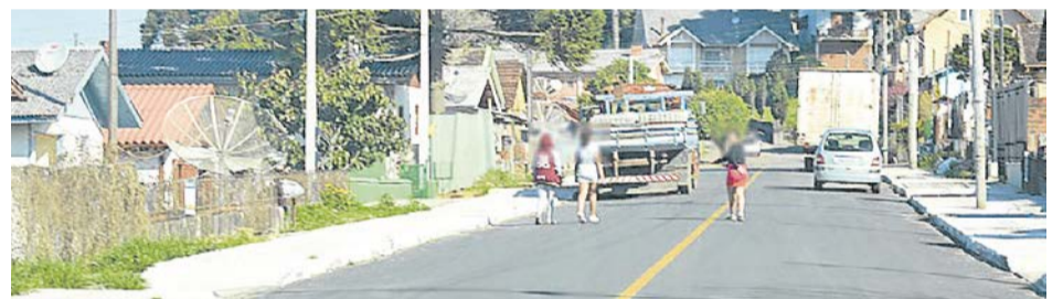
Ao perceber a presença da reportagem, as adolescentes deixaram a praça do bairro

te da investigação. Elas foram entregues à mãe, que relatou à Polícia que enfrenta dificulda-