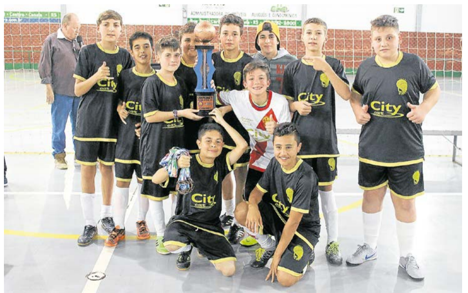
4º LUGAR: A.T.L.F. "B"/MERCADO TIRIRICA