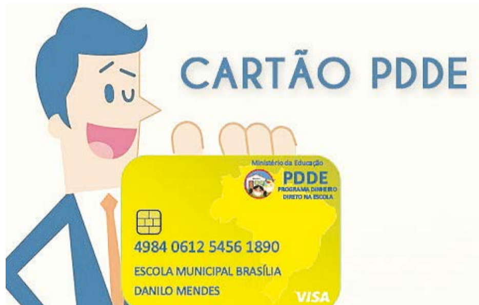
Cartão disponibiliza recursos do Governo Federal