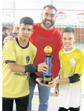
DEFESA MENOS VAZADO: A.T.L.F. "A"/CARIOCA PINTURAS - 03 GOLS SOFRIDOS