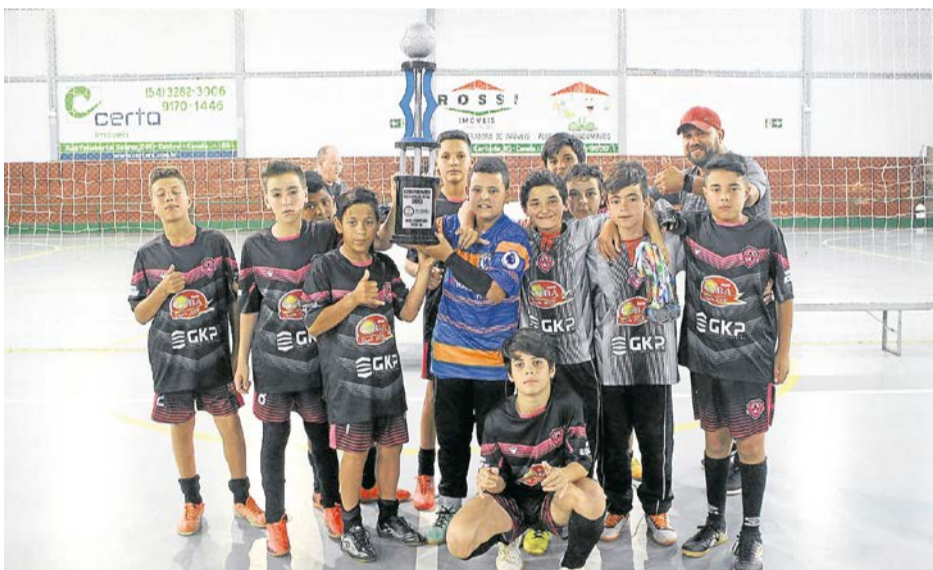
VICE-CAMPEÃO: GÊNIOS DA BOLA/M.S.