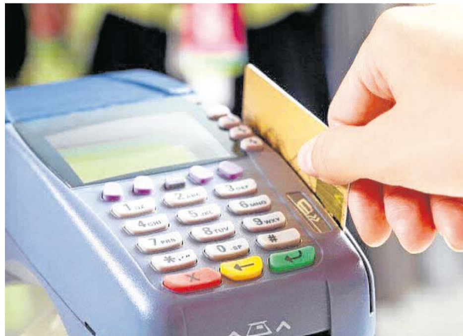
Valores podem chegar a meio milhão de reais