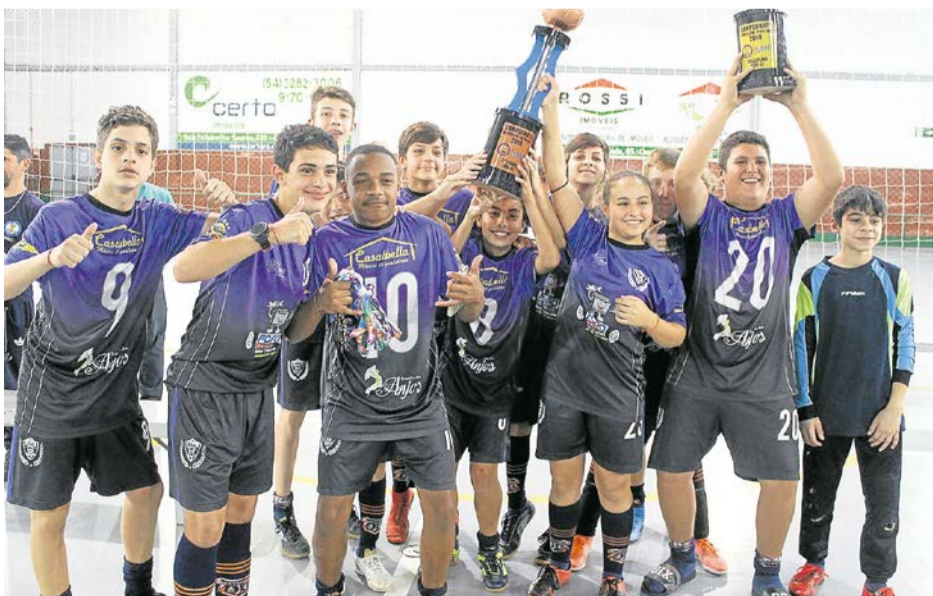
3º LUGAR: EDUCAESPORTES