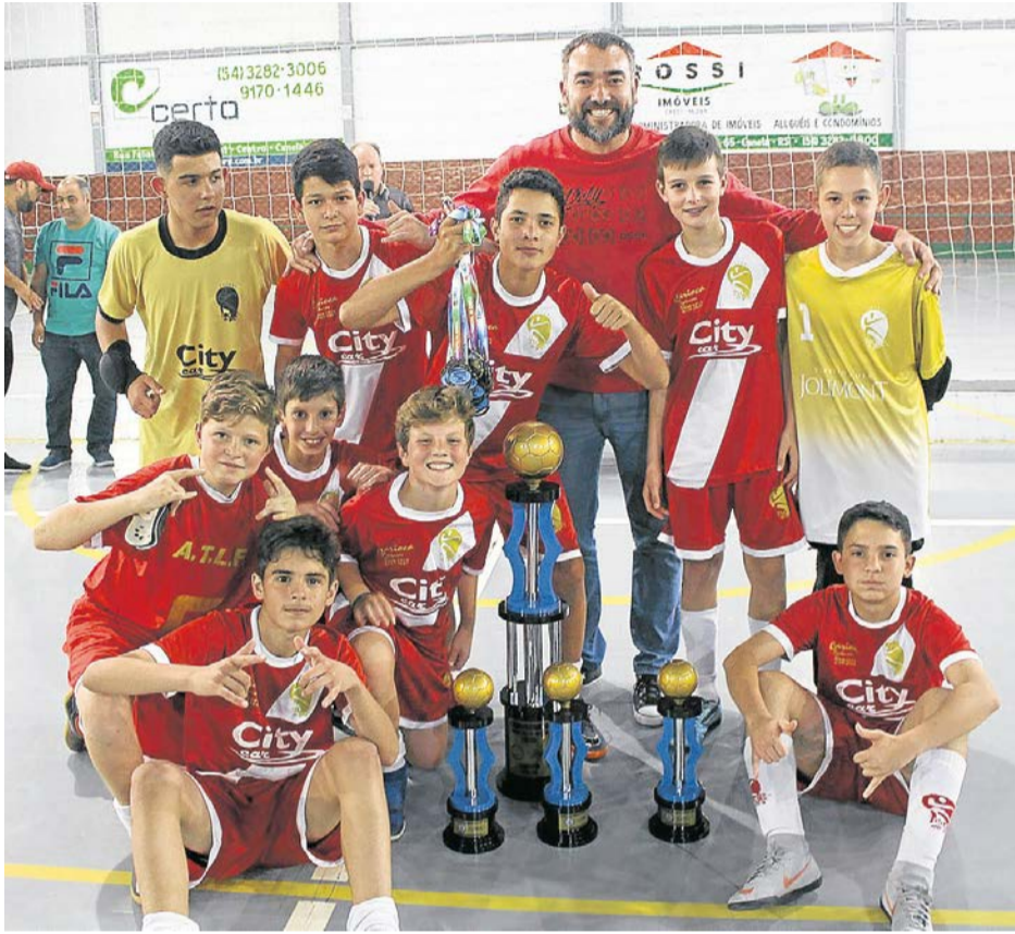
CAMPEÃO: A.T.L.F. "A"/CARIOCA PINTURAS