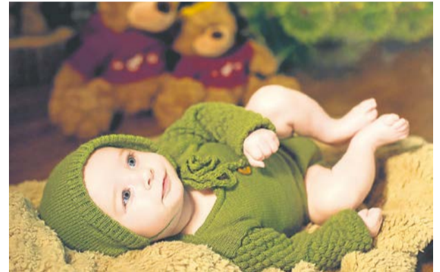
Gabriela, com 3 meses, ajudante de papai Noel.