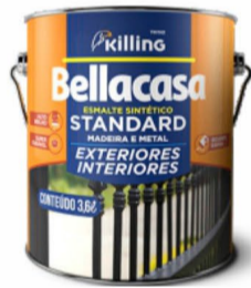
BELLACASA ESMALTE ALTO BRILHO BRANCA 3,6L R$ 60,00