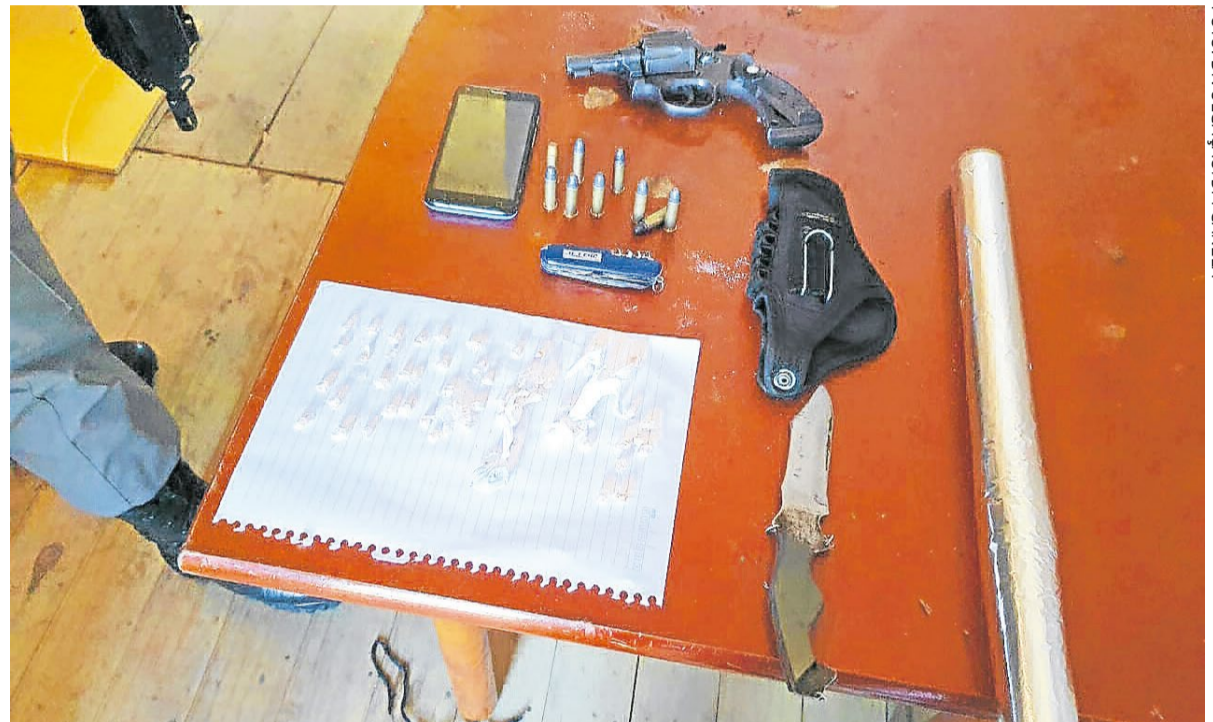
Ação no Chacrão apreendeu armas e drogas e implicou traficante de grupo rival

Porém, a investigação da Civil descartou a participação da dupla no ataque do sábado, que teve o barbeiro como vítima.