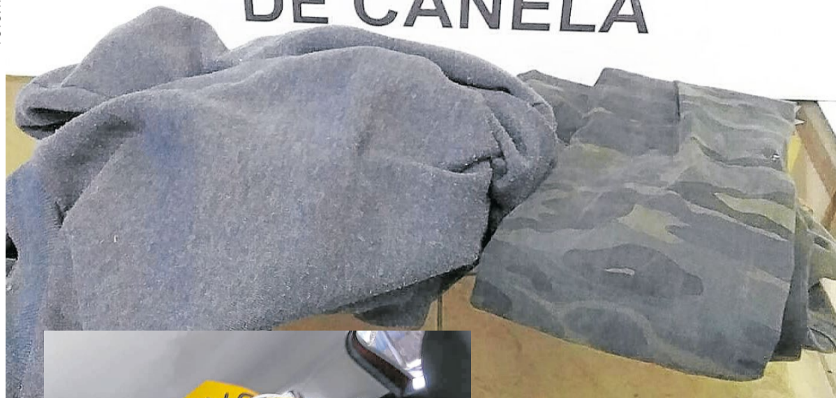
Roupas usadas por acusado foram apreendidas como prova do crime