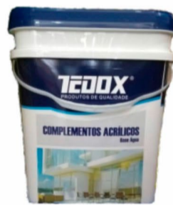
TEDOX SELADOR ACRÍLICO 18L R$ 72,00