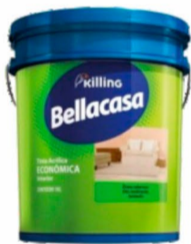
BELLACASA ACRÍLICO FOSCO BRANCO 18L R$ 120,00