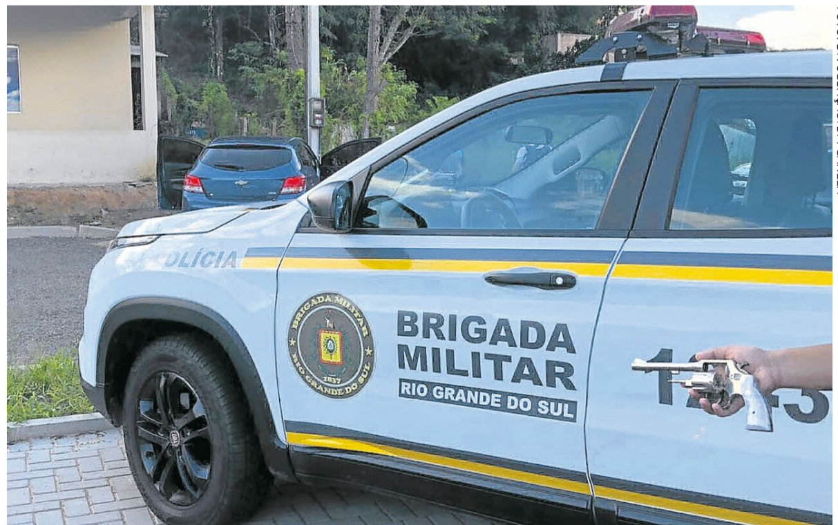
Arma usada para roubo de veículo foi apreendida

de arma de fogo. Neste momento, havia suspeita de que estivessem envolvidos nas tentativas de homicídio, mas, sem maiores evidências, os criminosos não ficaram presos, sendo liberados na tarde de terça, 27.