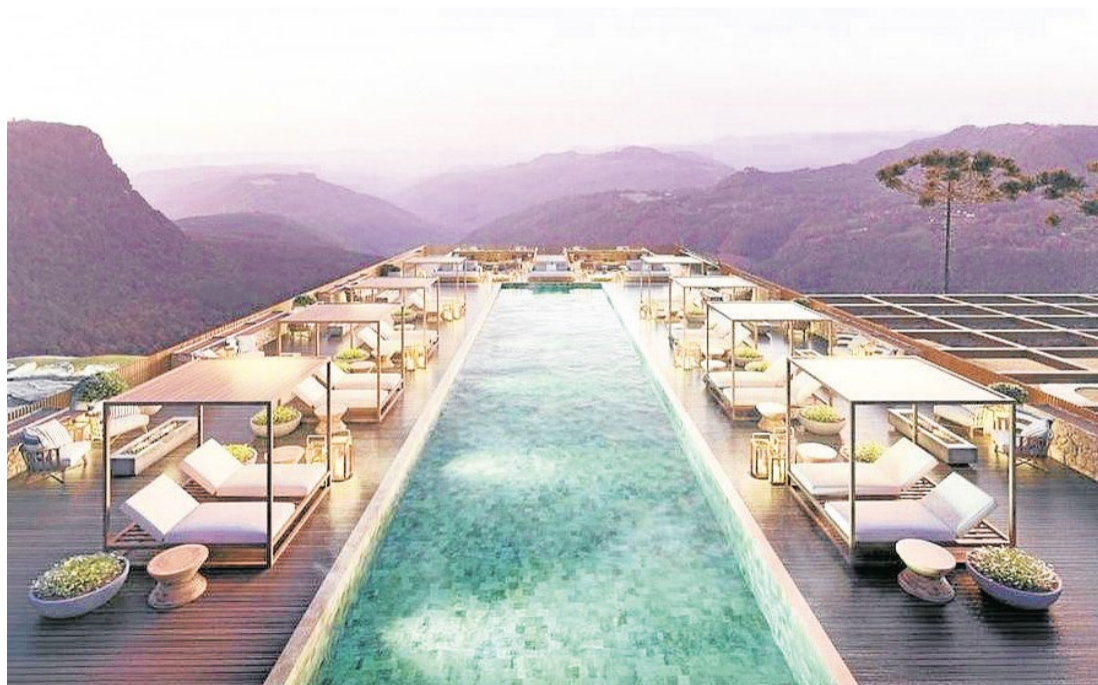
Uma das ideias propostas para a revitalização do Hotel

O projeto de revitalização segue em estudo no Conselho Municipal do Plano Diretor de Canela