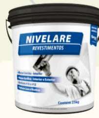
MASSA CORRIDA NIVELARE R$ 45,00

*Promoções válidas para pagamento à vista e até enquanto durar os estoques.