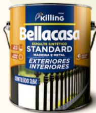
BELLACASA ESMALTE ALTO BRILHO BRANCA 3,6L R$ 60,00