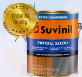
SUVINIL ESMALTE BRILHANTE PINTOU SECOU BRANCO 3,6L R$ 80,00

FACEBOOK: /FOLHADECANELA INSTAGRAM: @FOLHADECANELA