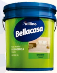
BELLACASA ACRÍLICO FOSCO BRANCO 18L R$ 120,00