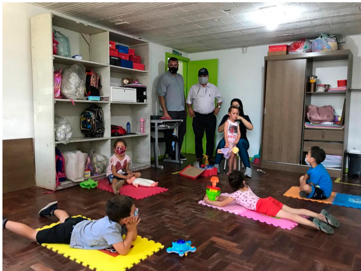
Aulas da educação infantil

O retorno as aulas na rede municipal é opcional e válido aos estudantes que os pais e responsáveis assinaram o registro dessa preferência por escrito.