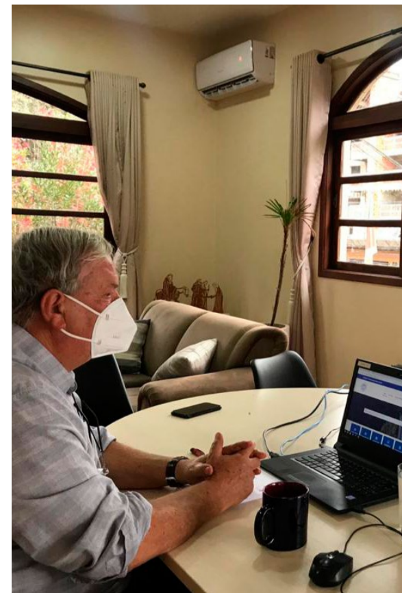
Reunião para retorno das atividades presenciais, com o Prefeito Constantino