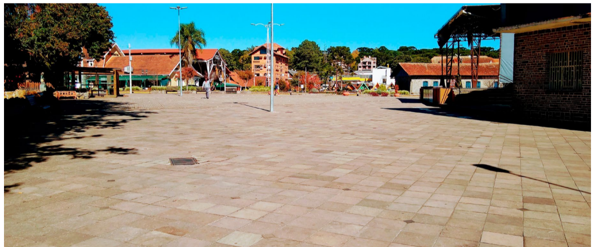
Largo deverá receber área coberta