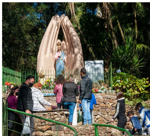
Fiéis movimentaram o Santuário na última quarta

responsabilidade e orgulho, sendo uma oportunidade de doar-se e trabalhar pelo Santuário, dando continuidade a esta história que já tem 61 anos. "Ser coordenador é uma graça", encerra ele, que contraiu Covid-19, em 2020 e credita sua cura a Mãe de Caravaggio.