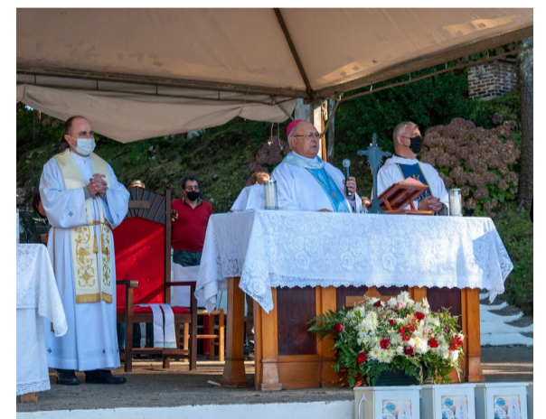
Celebração aconteceu em frente ao Monumento da Prece