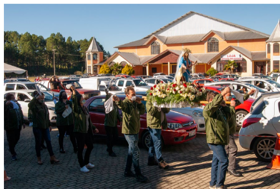
Organização estima que mais de mil veículos participaram da romaria do dia 26