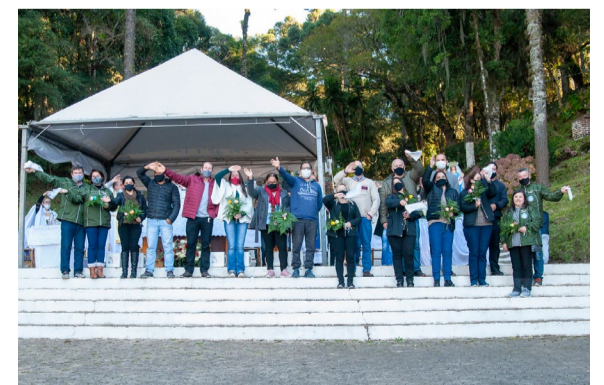
Festeiros atuais apresentaram os responsáveis por realizar os próximos eventos