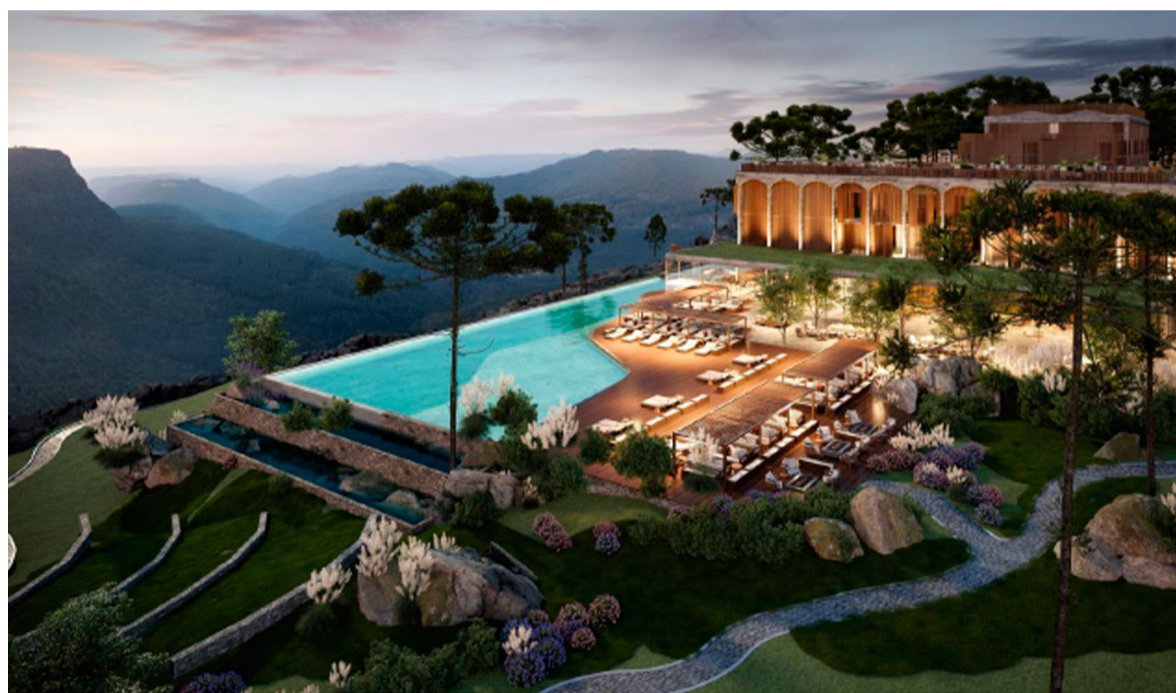
Projeto do novo Laje de Pedra

Será que a Câmara acredita que representa mais o povo do que a Brigada Militar, do que o Corpo de Bombeiros ou que a Polícia Civil, por exemplo? Eu até poderia fazer uma enquete nas redes sociais da Folha, mas não quero fazer os