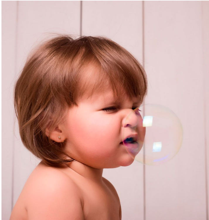
Muita fofura da Isabella.