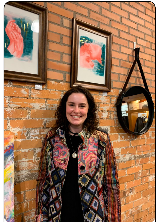
Artista plástica Renata Guzenski.