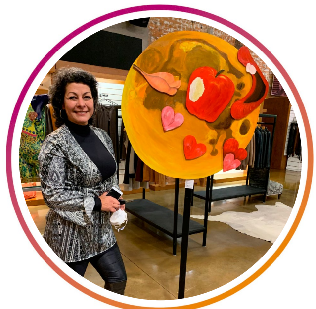
Artista plástica Marione Fão.