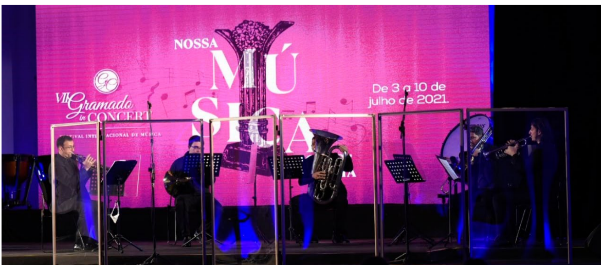
Gramado In Concert segue até sábado, com concertos noturnos diários

Mais informações e programação completa: www.gramadoinconcert.com.br