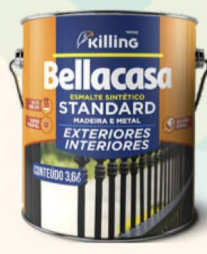
BELLACASA ESMALTE STANDARD ALTO BRILHO BRANCA 3,6L R$ 63,00