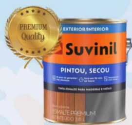
SUVINIL ESMALTE BRILHANTE PINTOU, SECOU BRANCO 3,6L R$ 82,00

• Apartamento nº 402, com 01 dormitório, sala de estar/jantar, cozinha conjugadas, área de serviço, banheiro social, com área privativa de 39,37m². Localizado na Rua Londres, nº 138, Eugênio Ferreira. Aluguel R$1.100,00 + taxas.