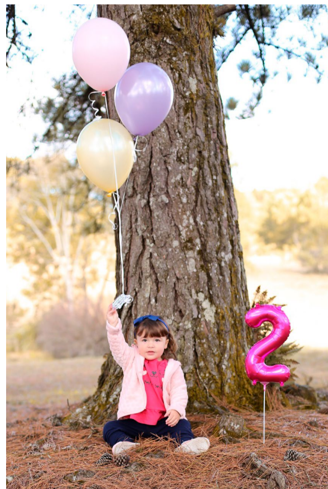
Sofia, que no dia 10 de junho completou 2 aninhos!