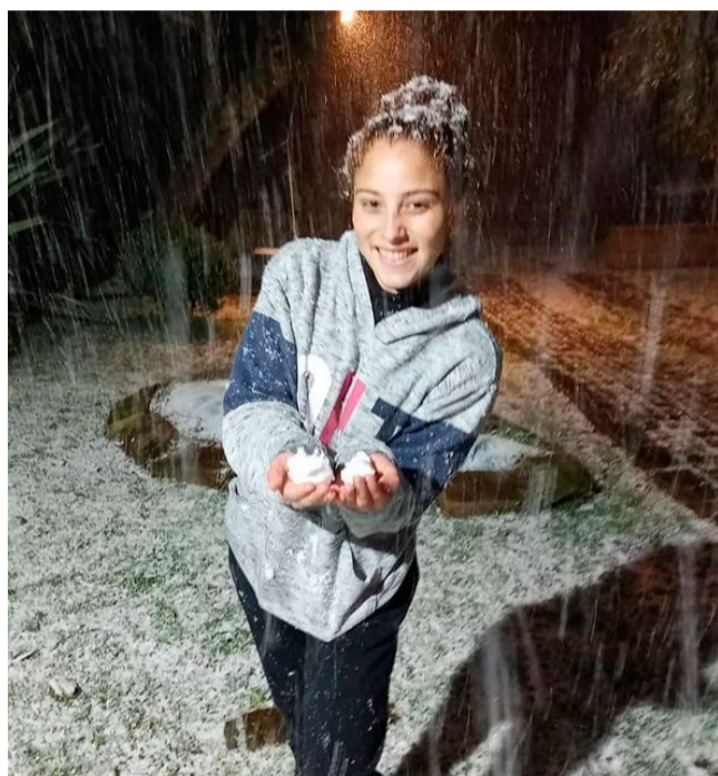
CANTORA RAQUEL SOUZA