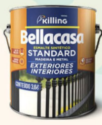
BELLACASA ESMALTE ALTO BRILHO BRANCA 3,6L R$ 63,00