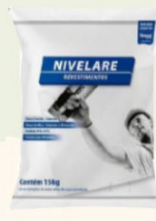
MASSA CORRIDA 15KG R$ 22,00