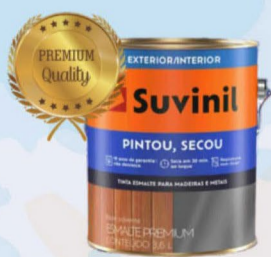
SUVINIL ESMALTE BRILHANTE PINTOU, SECOU BRANCO 3,6L R$ 82,00

• Sala Comercial, nº 06, Espaço com 33,90 m² e 01 banheiro, com 03 vitrines grandes. Conta com equipe de RP e assessoria. Localizado com frente na Rua Osvaldo Aranha, 333, fundos para Rua Danton Correa da Silva, Bairro Centro, Passeio das Cores. Aluguel R$2.100,00 + taxas.