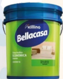
BELLACASA ACRÍLICO FOSCO BRANCO 18L R$ 130,00