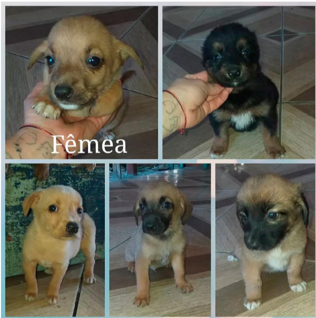
Veja alguns dos cães que estarão disponíveis para adoção responsável.

Para saber mais sobre o trabalho da Amor Sem Raça e ajudar no seu trabalho, basta visitar a feira, que acontece de 15 em 15 dias, sempre na Estação Campos de Canela.