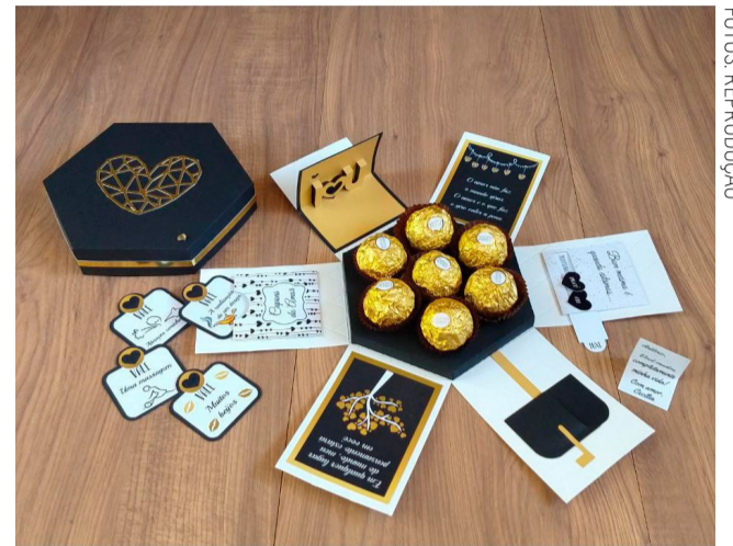
Itens à venda ajudam a reforçar o trabalho de castração.