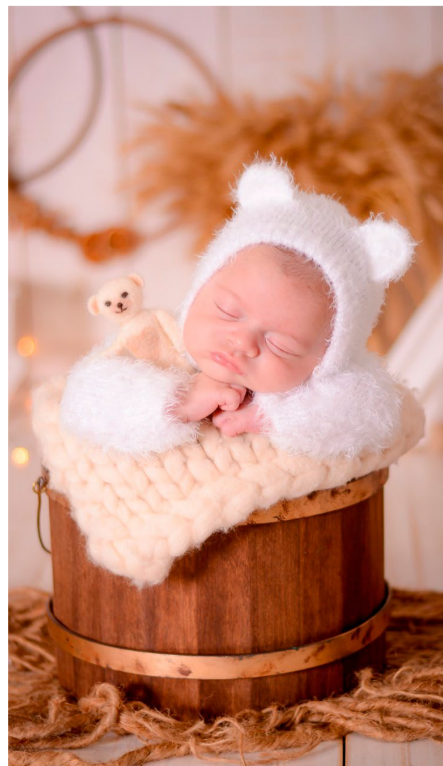
Leonardo no ensaio fofo do seu 1 mês.