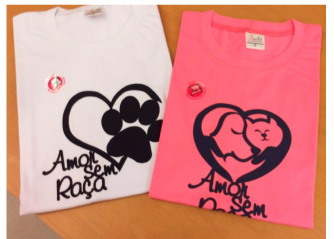
Além de ser uma ótima opção de presente