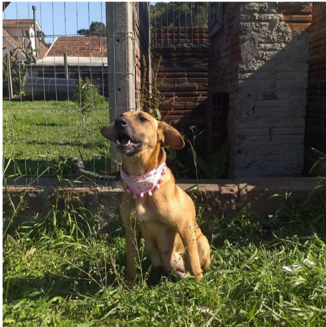
Todos os filhotes já realizaram a primeira vacina e têm castração garantida.