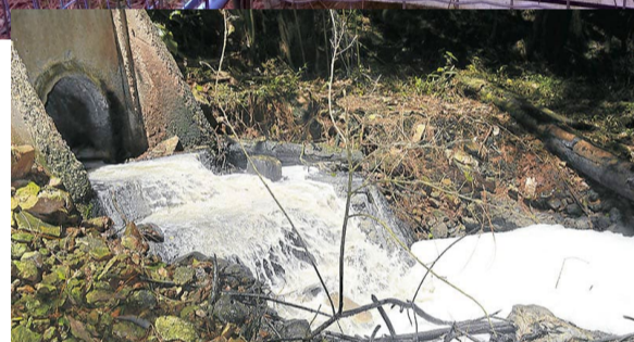
Aspecto do lançamento de efluentes no Arroio Santa Terezinha em 2019