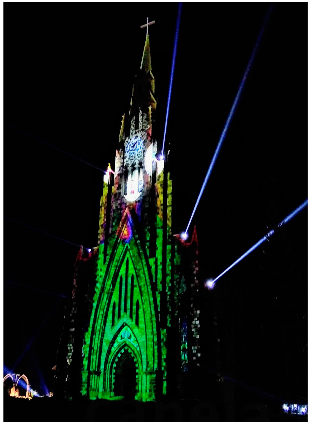
Espetáculo Vida e... A Fábrica de Sonhos, serão atrações de som, luz e projeção mapeada