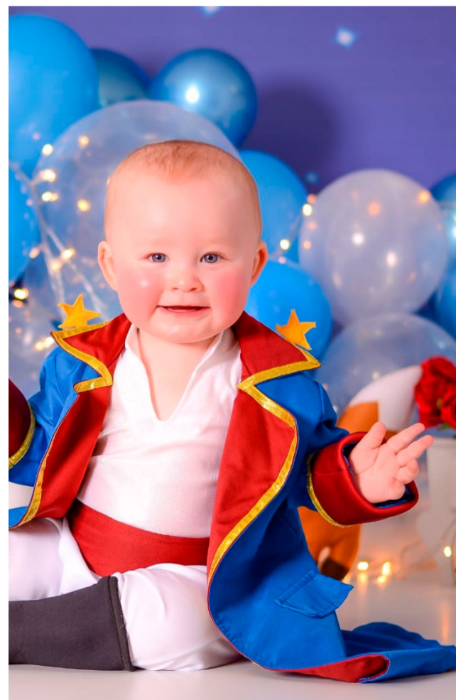
O príncipe Joaquim completará seu primeiro reinado no dia 12. Feliz Aniversário com amor e carinho do papai e da mamãe.