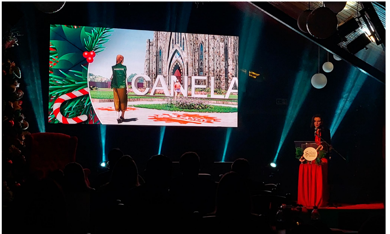
Demarcações no chão, em frente à Catedral, tem o objetivo de colaborar com o distanciamento

O 34º Sonho de Natal é uma realização da Prefeitura de Canela, por meio da Secretaria Municipal de Cultura e Turismo, Secretaria Especial da