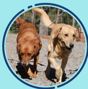
Mana e Mano