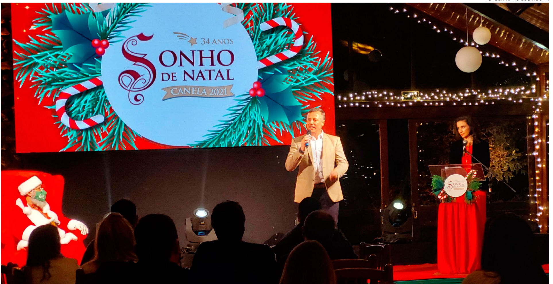
Papai Noel chegou à cidade para sua estadia a partir de 22 de outubro