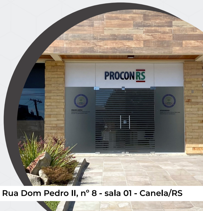
Rua Dom Pedro II, nº 8 - sala 01 - Canela/RS