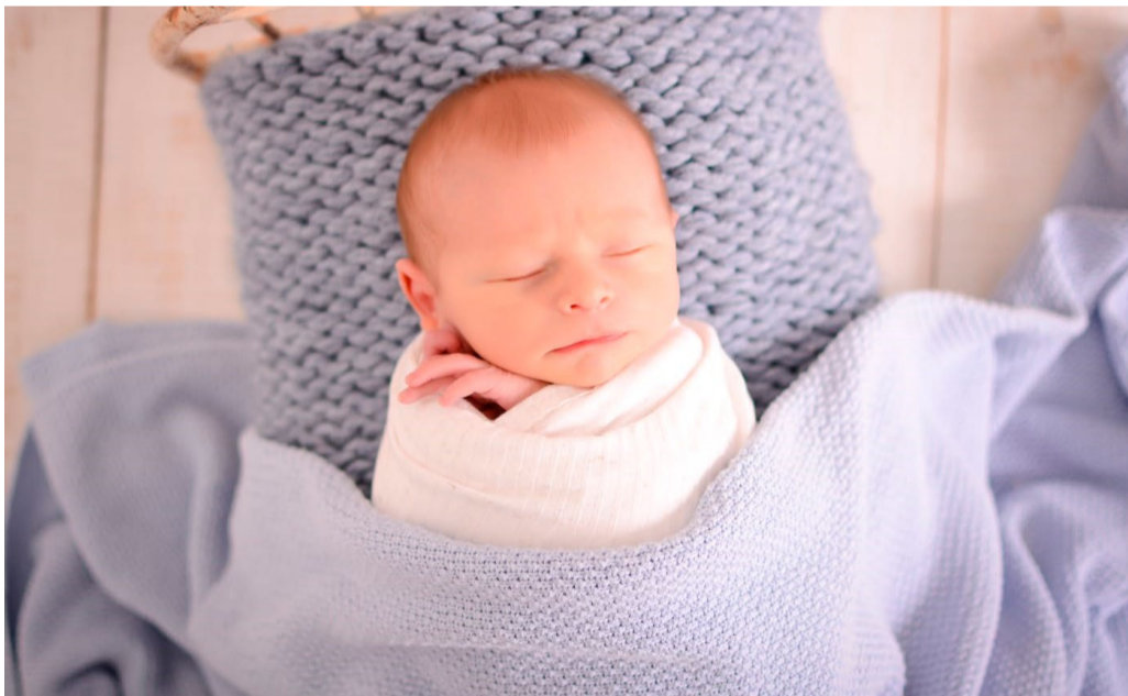
Registro dos 14 dias do Benício.