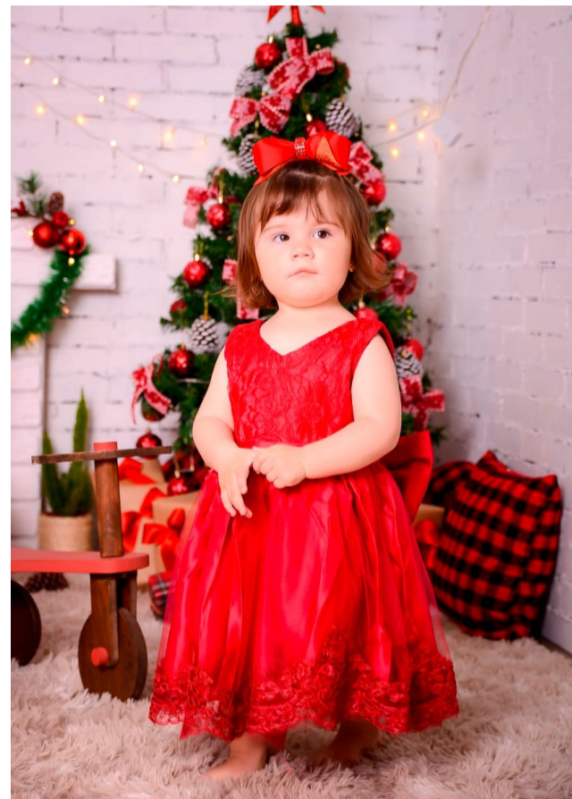
Ensaio de Natal da Romana!