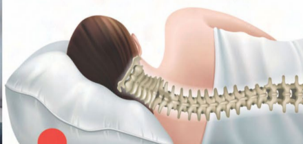
Travesseiro não recomendado