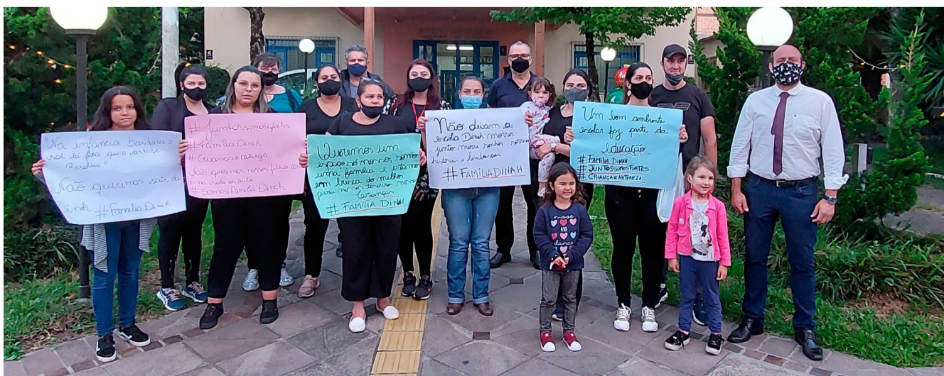
Sessão da Câmara foi interrompida pelo protesto

A presidência da Câmara, então, decidiu dar acesso a três representantes e um deles ocupou a Tribuna do Povo para expor suas indignações.