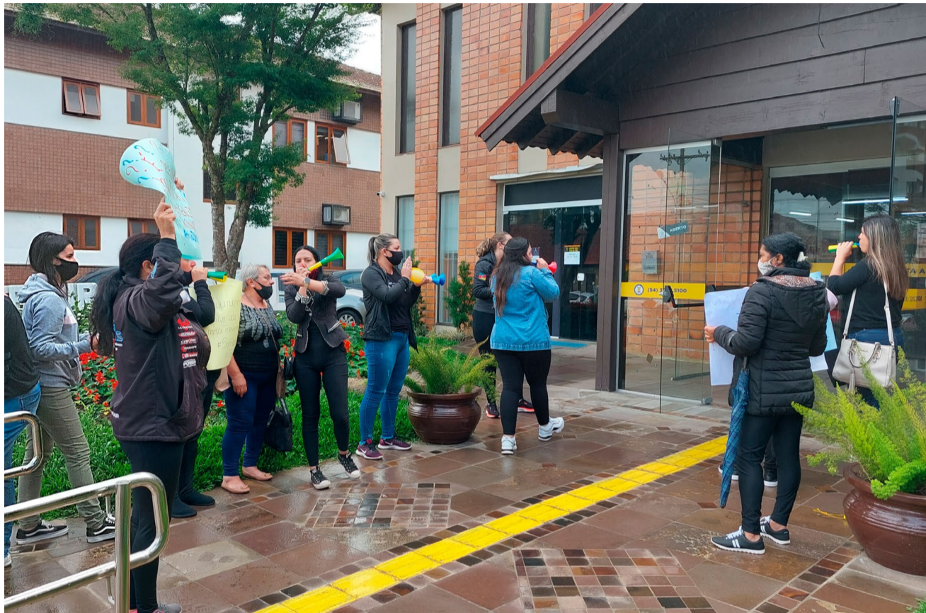
Manifestação aconteceu na entrada da Prefeitura, mas os pais não foram recebidos pelo Prefeito

As perguntas que os pais da EMEI Dinah Signori fazem seguem sem resposta presencial da Prefeitura, apenas manifestações pela imprensa ou redes sociais.