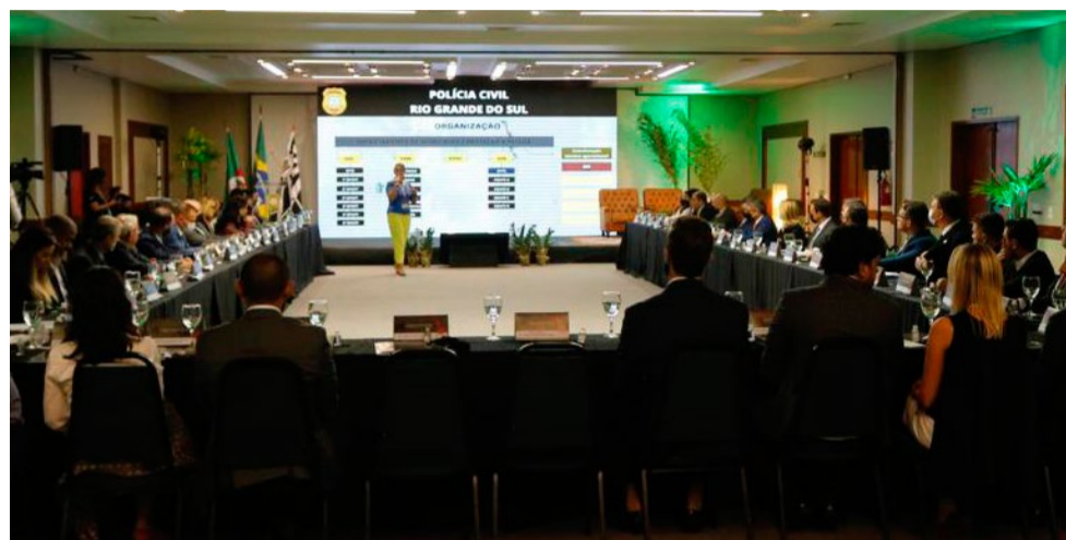
Evento reuniu Diretores e Delegados de DHPPs de todo o Brasil

Para a Chefe de Polícia, que discursou na abertura do encontro, "as discussões que por aqui passarão serão levadas aos Chefes e Diretores-gerais de Polícia que se