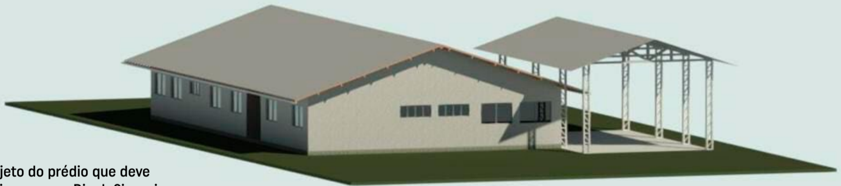
Projeto do prédio que deve abrigar a nova Dinah Signori

A Prefeitura de Canela emitiu nota, após a manifestação de segunda (29), na Câmara de Vereadores, no texto enviado pela Assessoria de imprensa, a Secretaria Municipal de Educação, diz que, em parceria com uma empresa terceirizada, prepara um novo espaço para abrigar a EMEI Dinah Reis Signori,