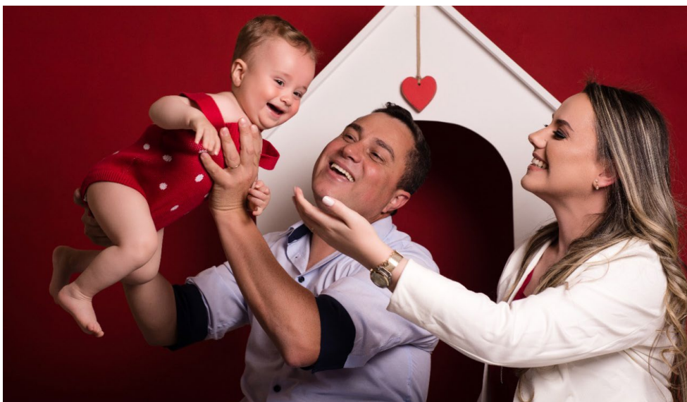
Família do Benício!