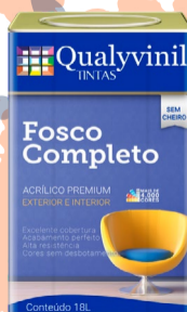
QUALYVINIL FOSCO ACRÍLICO PREMIUM BRANCO 18L R$300,00