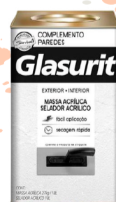
SUVINIL GLASURIT SELADOR ACRÍLICO 18L R$90,00

*Promoções válidas para pagamento á vista em JANEIRO/2022.