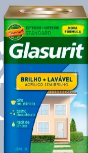
SUVINIL GLASURIT SEMIBRILHO ACRÍLICO 18 L R$380,00