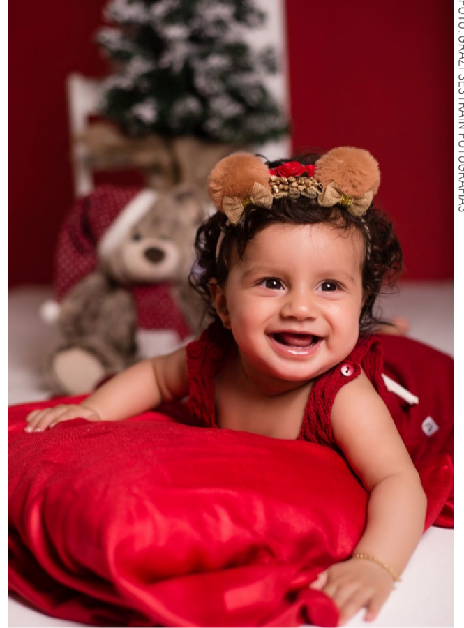
Sorriso bangela mais fofo da Aurora!