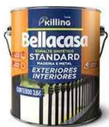
BELLACASA ESMALTE ALTO BRILHO BRANCA 3,6L R$75,00

• Apartamento nº502A, finamente mobiliado e decorado, conta com 01 suíte, 02 dormitórios, banheiro social, cozinha ampla, área de serviço, sala espaçosa com sacada, lavabo, hall de entrada e 02 vagas de garagem coberta. Conta com ar condicionado instalado nos cômodos, eletrodomésticos funcionando e tudo novo, em perfeito estado. Localizado na Praça João Correa, nº27, Campos de Canela I, Centro. Aluguel R$5.500,00 + taxas.