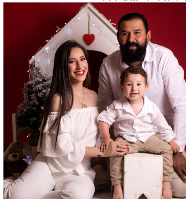
Família do Vicente pelas lentes da Grazi Sestrain!