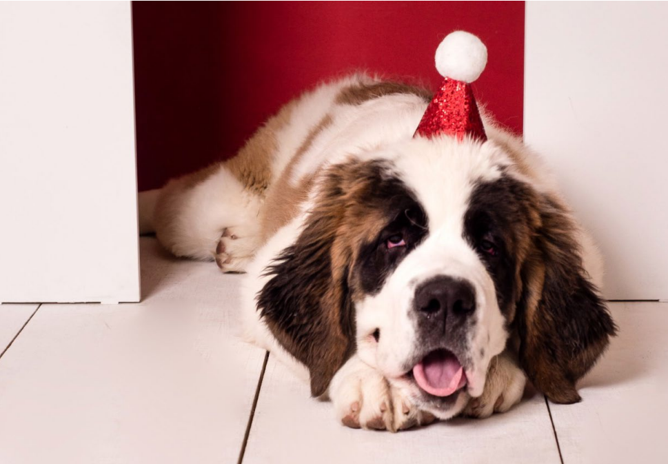
A Madalena também fez ensaio.