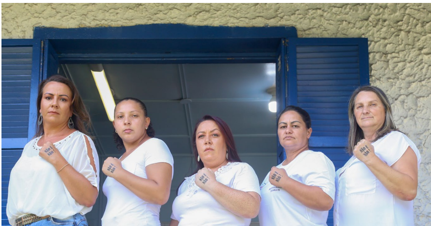
Equipe da Assistência Social