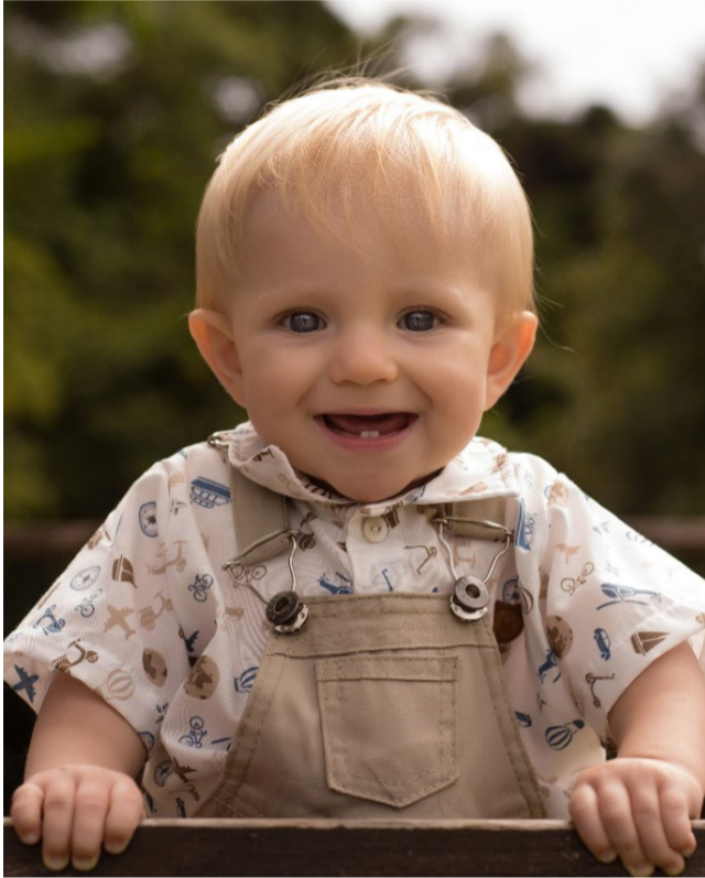
Thomas e toda a pureza desse ensaio feito pela Grazi Sestrain.