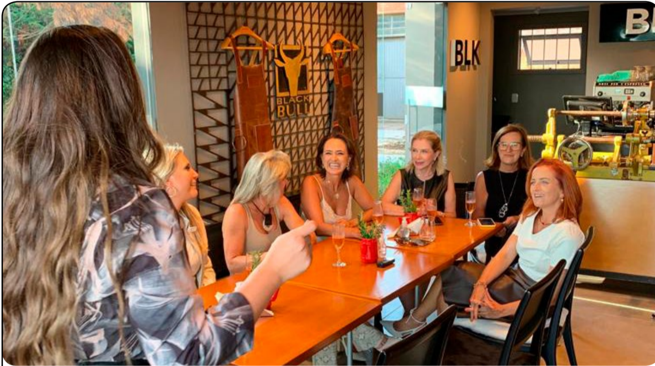
Recentemente, tivemos o encerramento do Provador Black Bull, onde reunimos as cinco participantes, mulheres inspiradoras, em um happy hour para relembrar os melhores momentos do projeto.