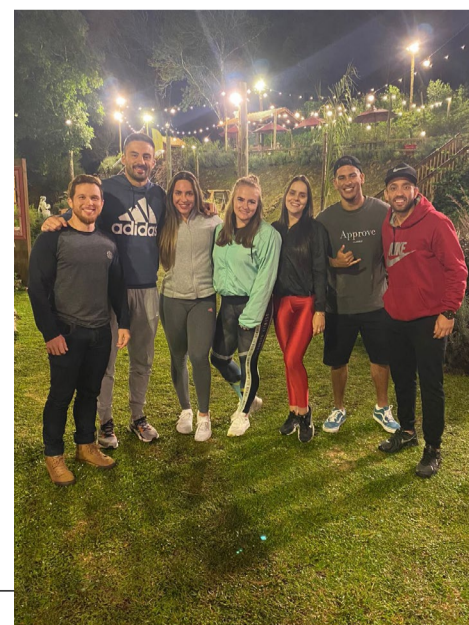
No dia 25 de março, comemorou-se o aniversário de 3 anos da Academia For Fit Treinamento Feminino, em um jantar muito alegre na Villa Italia em Gramado juntamente com todos estes super profissionais, que hoje fazem parte da equipe. Sucesso e Vida longa à For Fit!