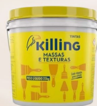
Killing Massa Acrílica 25 Kg