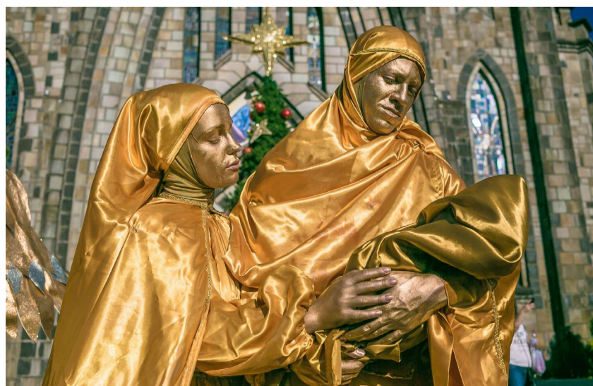
Espectáculo Mensageiros de Luz e Vida

O evento ainda contará com a Procissão do Encontro, dia 15 e a 1ª corrida de Páscoa, dia 10, também fazem parte da programação.