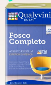
Qualyvinil Fosco Premium Acrílico Branco 18 L