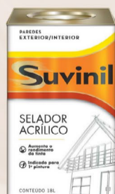
Suvinil Selador Acrílico 18 L