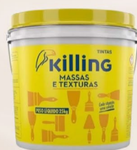
Killing Massa Acrílica 25 Kg