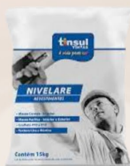
Nivelare Textura Grafato Rústico 15 Kg