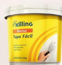
Killing Massa Tapa Fácil 340 g