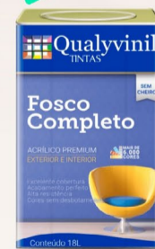
Qualyvinil Fosco Premium Acrílico Branco 18 L