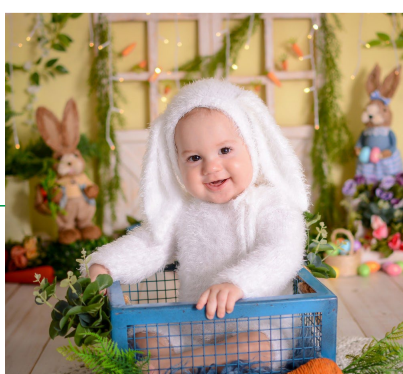
Ravi todo fofo no seu ensaio de coelhinho.