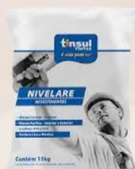
Nivelare Textura Grafato Rústico 15 Kg