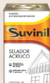
Suvinil Selador Acrílico 18 L