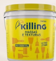
Killing Massa Acrílica 25 Kg