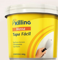
Killing Massa Tapa Fácil 340 g