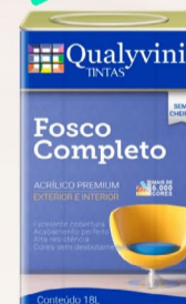
Qualyvinil Fosco Premium Acrílico Branco 18 L