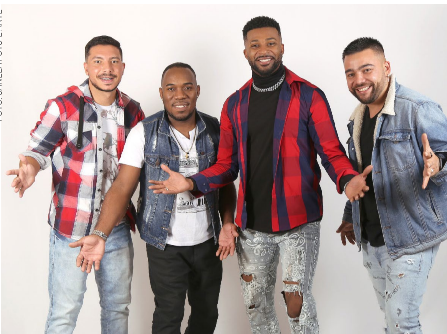
A Banda P6N, Passou das 6 é Noite, num ensaio descontraído para divulgação dos shows que acontecem diariamente pela região! Acompanhe os trabalhos pelo Instagram da banda, @passoudas6noite