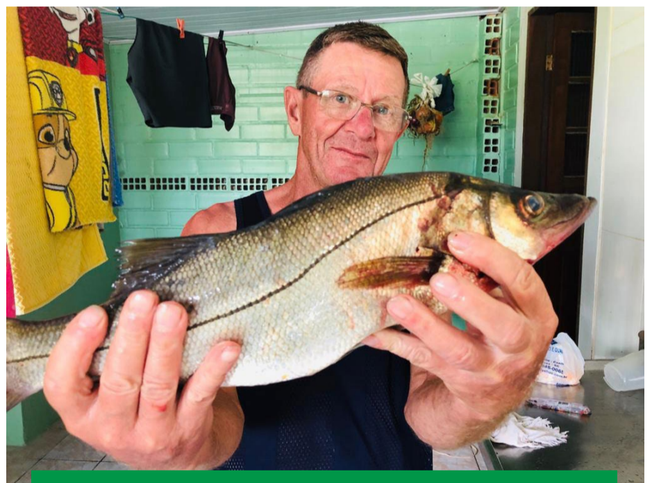
Uma das paixões do vovô, pesca!

Cerca de 60kg de feijão colhidos apenas esse ano. O agricultor planta, colhe, bate limpa e armazena