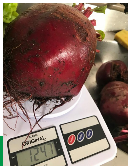
Resultado da sua horta, uma beterraba de 1,2kg.