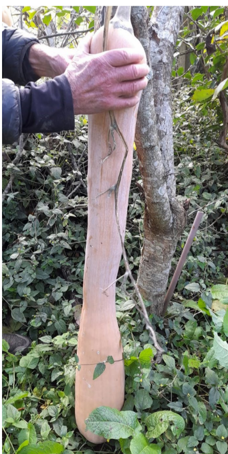
Entre seus maiores orgulhos, uma abóbora de 1,10m!

Cerca de 60kg de feijão colhidos apenas esse ano. O agricultor planta, colhe, bate limpa e armazena