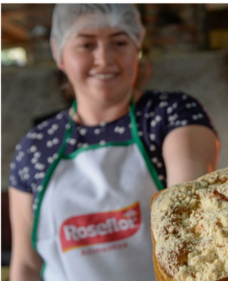
Neste ano, a Festa Colonial acontece na Praça João Corrêa