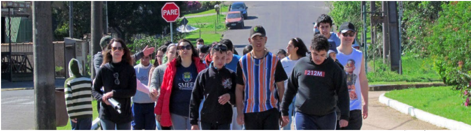
APAE E ESCOLA ESPECIAL RODOLFO SCHLIEPER REALIZARAM UMA CAMINHADA, NO PARQUE DO LAGO, NA MANHÃ DA ÚLTIMA QUINTA.