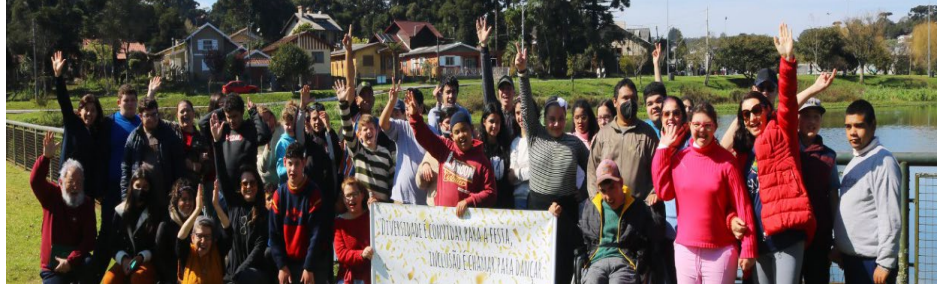
PAIS, ALUNOS E PROFISSIONAIS PARTICIPARAM DA ATIVIDADE.