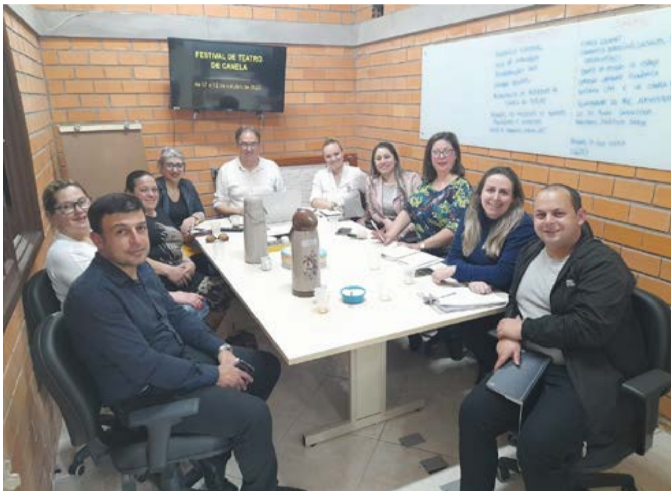
Reunião de planejamento do festival