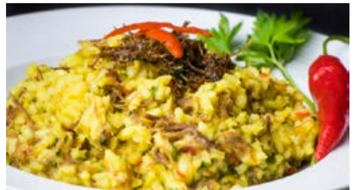
Risoto de Charque com Pimenta Suave do Marcela's Café & Bistrô.