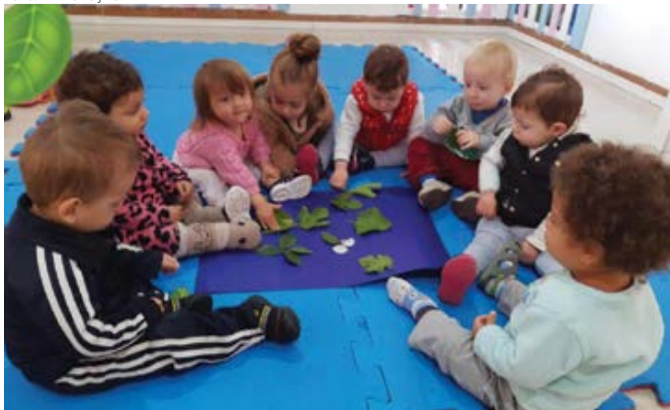
B2 da Oficina da Criança realizando atividade de colagem e textura.