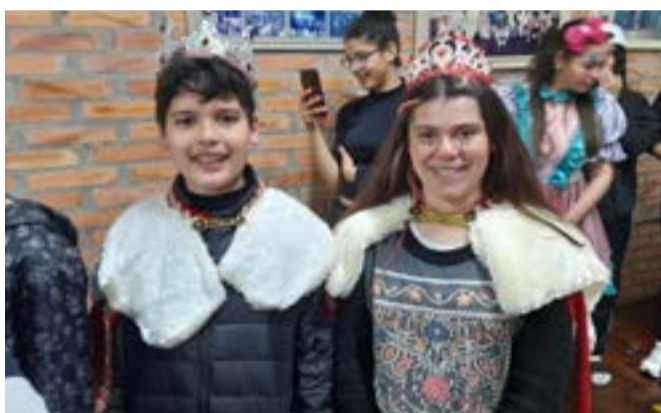
Rei e Rainha da Festa