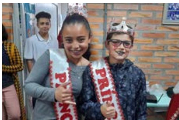
Princesa e Príncipe da Festa