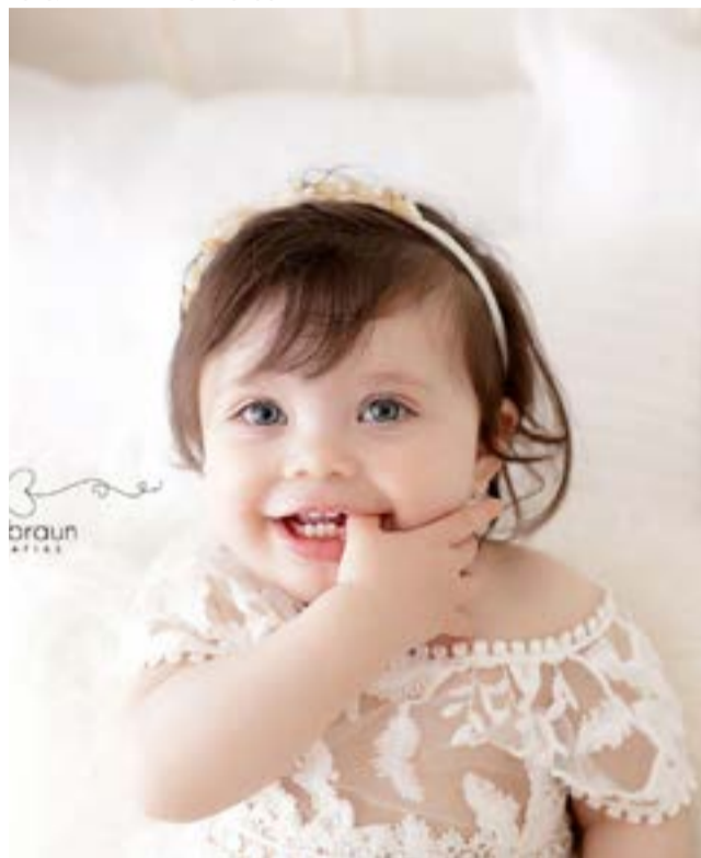
Aurora faz 1 aninho!