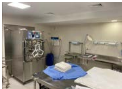
Novo CME – Centro de Materiais e Esterilização