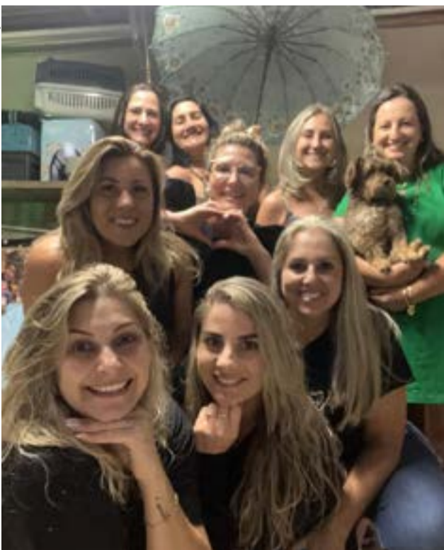
Confraternização de final de ano dessa turma de Pedal super alto astral!