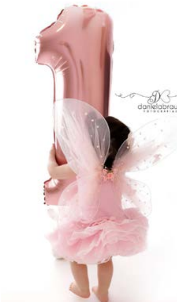
Aurora faz 1 aninho!