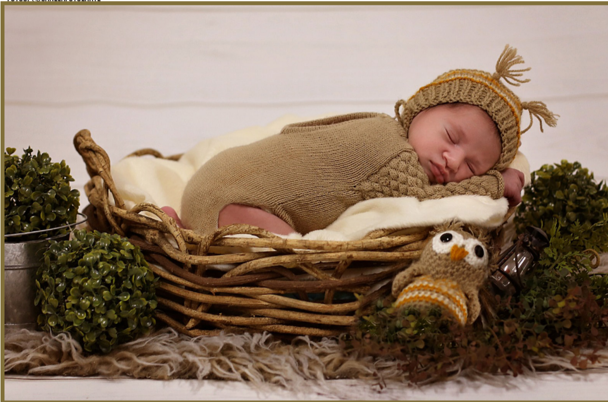
Joaquim, no seu primeiro ensaio com 13 dias!