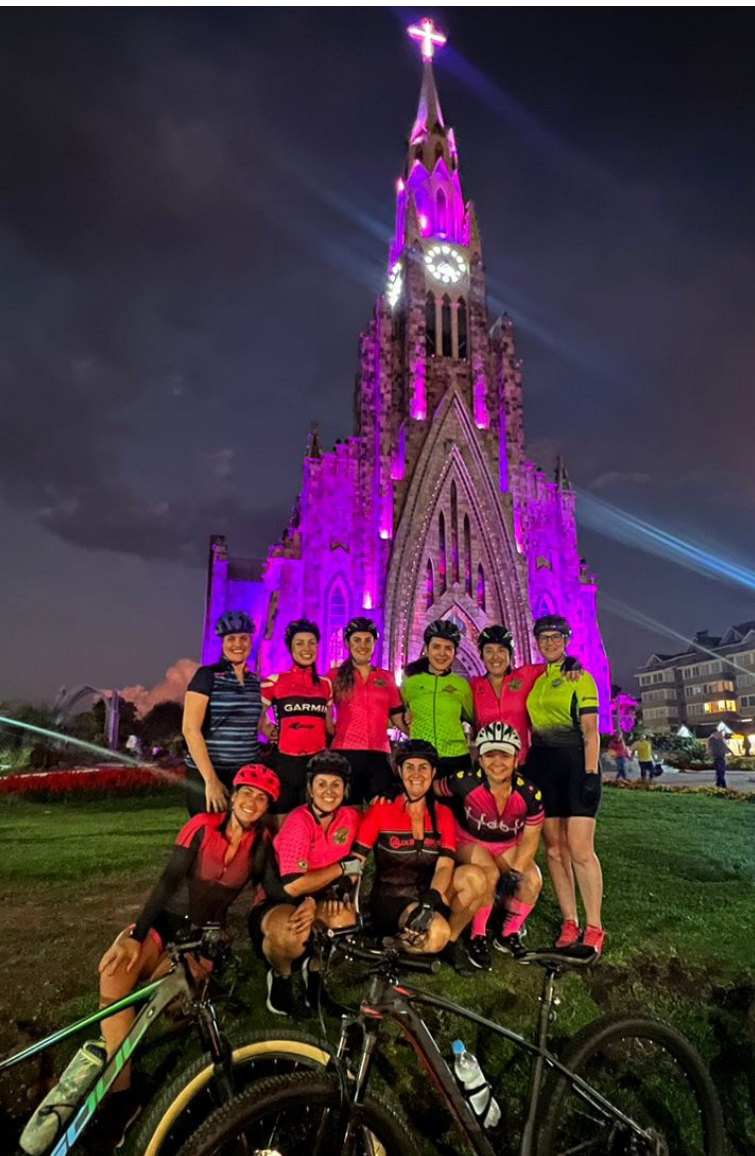
Pedal Gourmet realizou, na noite de ontem, um pedal noturno em homenagem ao Dia Internacional da Mulher. Parabéns pela iniciativa e feliz dia à todas!