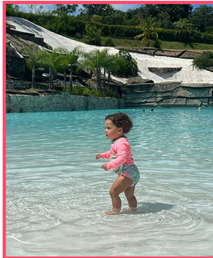
Ísis aproveitando a maior praia artificial com águas naturalmente quentes do mundo na Praia do Cerrado, no Rio Quente Resorts, GO!