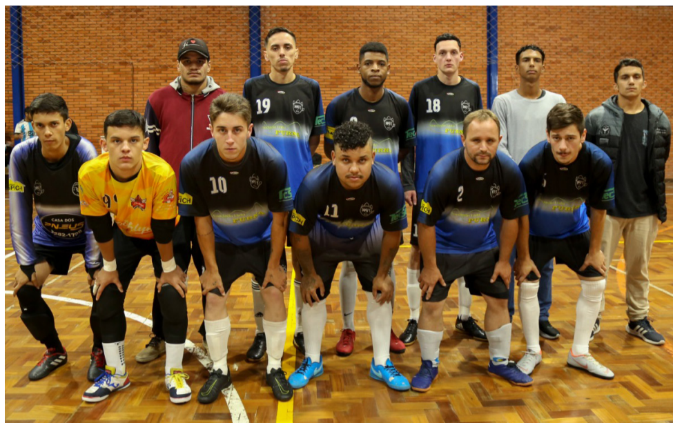
Equipe do Tirivinhas