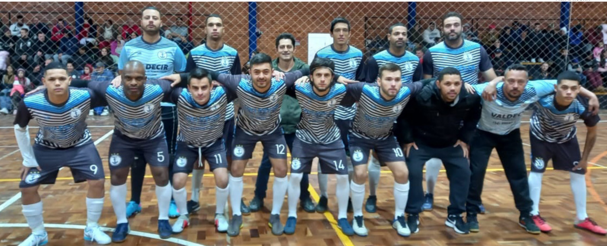
Equipe do Âncora