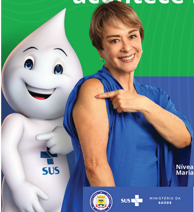
Nívea Maria Atriz