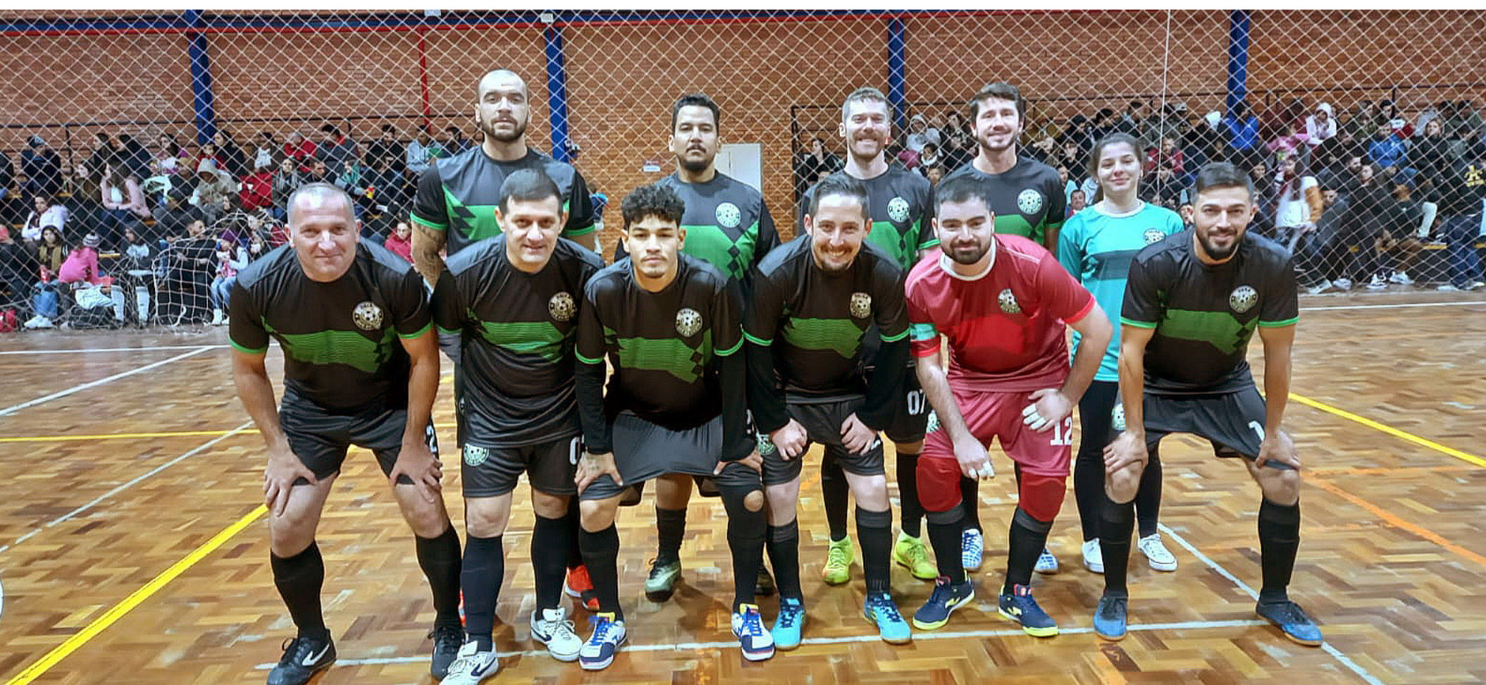
Equipe do Deixa que Eu Chuto