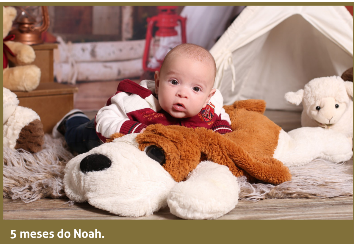
5 meses do Noah.