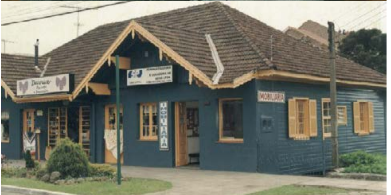
Ao lado, a segunda sede, na Av. Osvaldo Aranha, 188