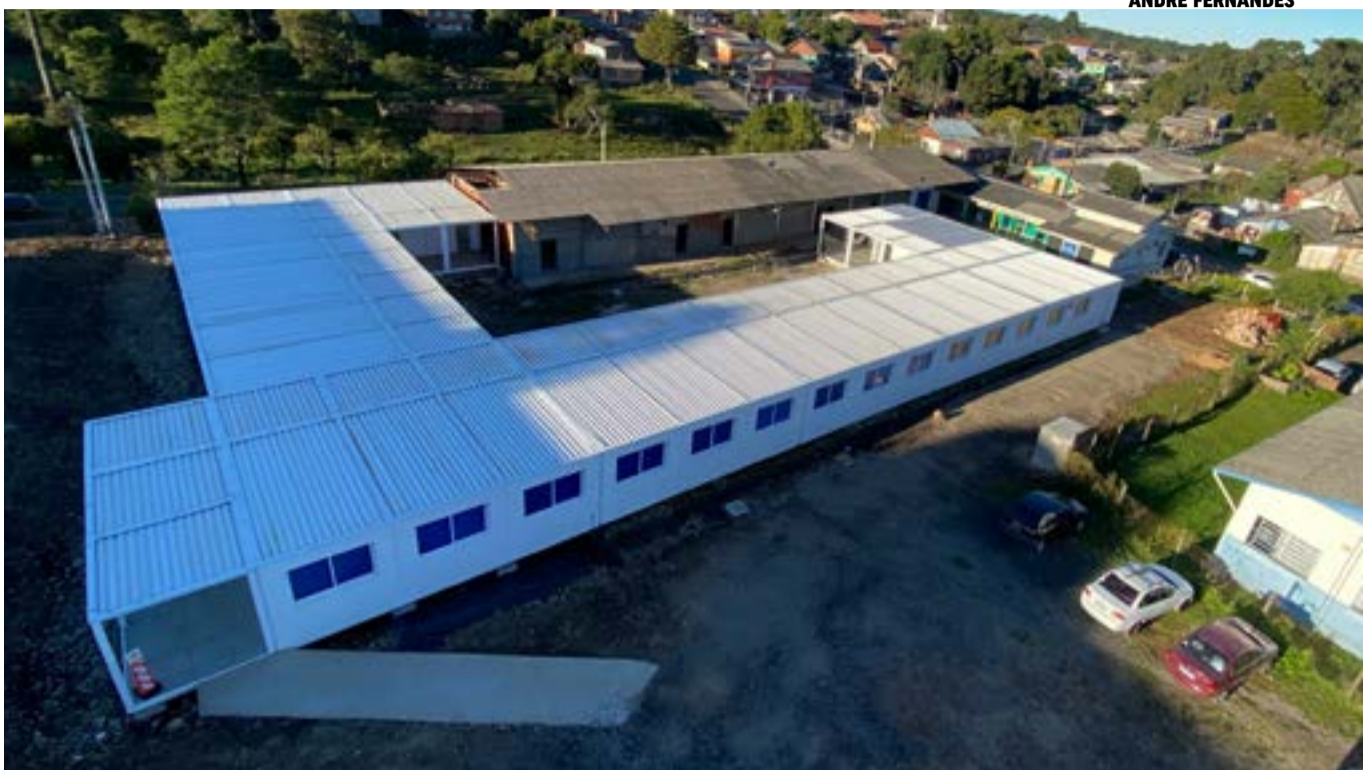
Escolas Municipais Professora Noeli de Azevedo e Souza, no Bairro Santa Marta