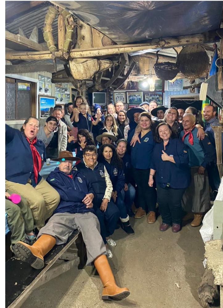
No dia 10 de junho, o Grupo de Cavalgada Pé no Estribo comemorou 15 anos de sua fundação. É o grupo de Cavalgada mais antigo de Canela ainda em atividade. Parabéns aos participantes!