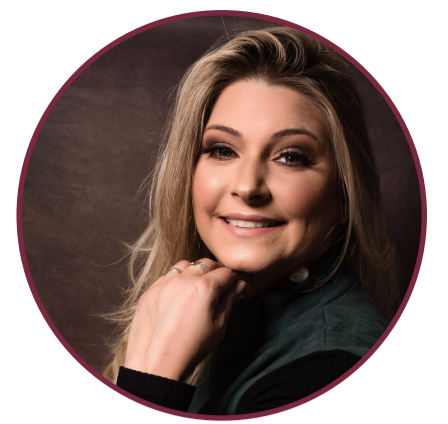
Bethy Schons @bethyschons