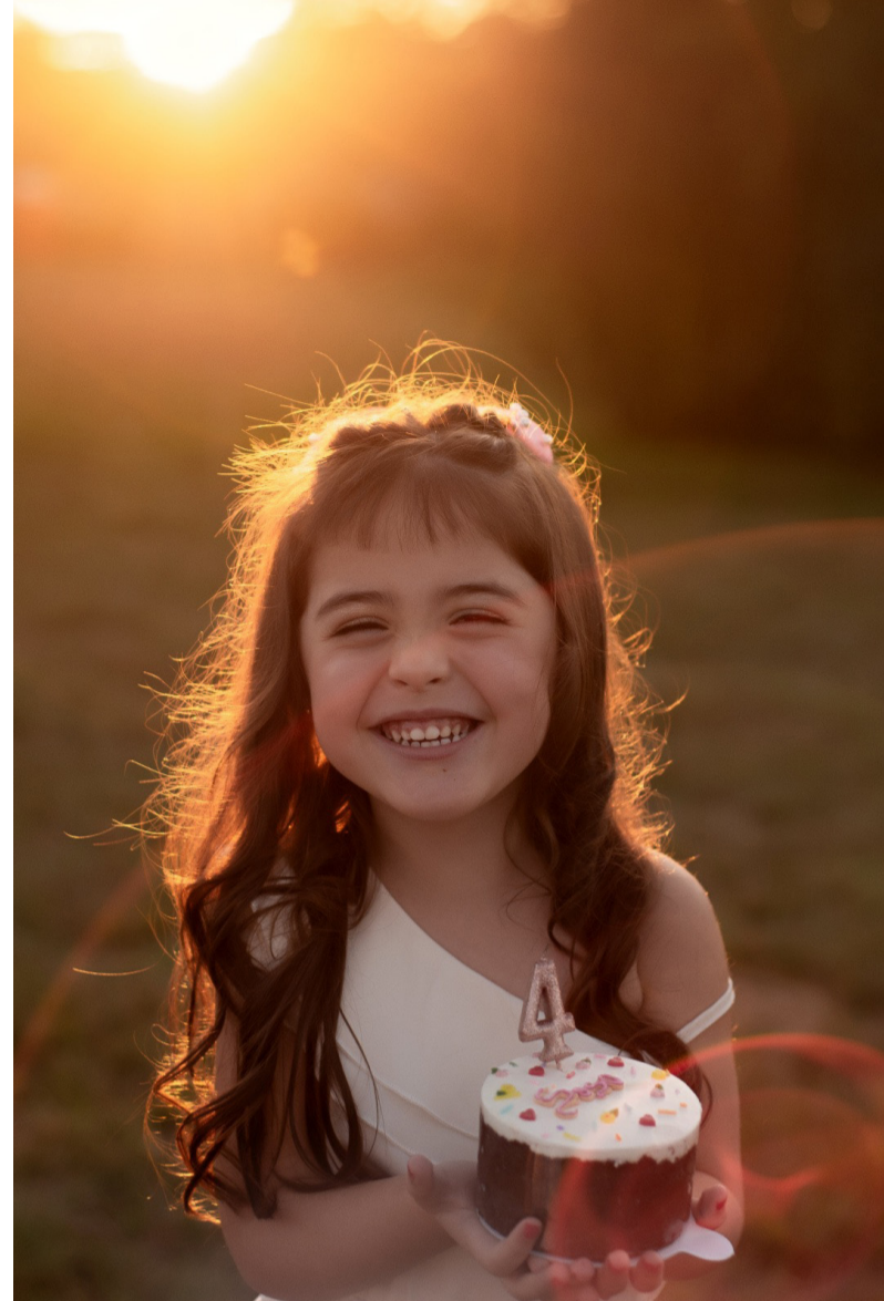
4 aninhos da gatinha Ana Sophia!