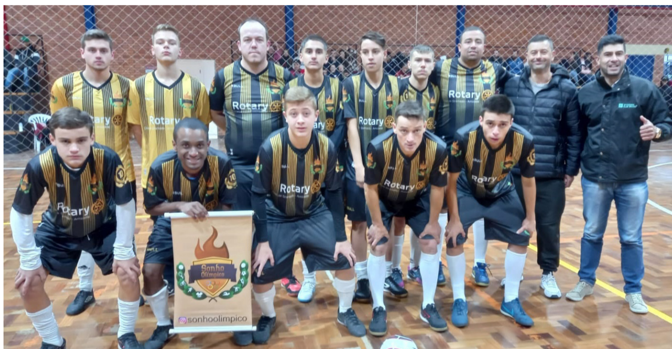
O Sonho Olmpico  um dos times que disputaro as quartas de final

Jogo 4 – Vencedor de Saideira e MB Sports x Vencedor de Galera do Estevo x Deixa Que Eu Chuto