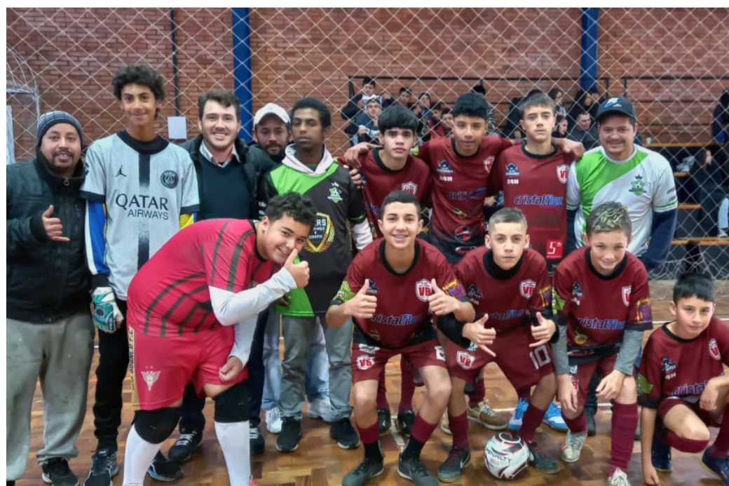
Galera do Estevão