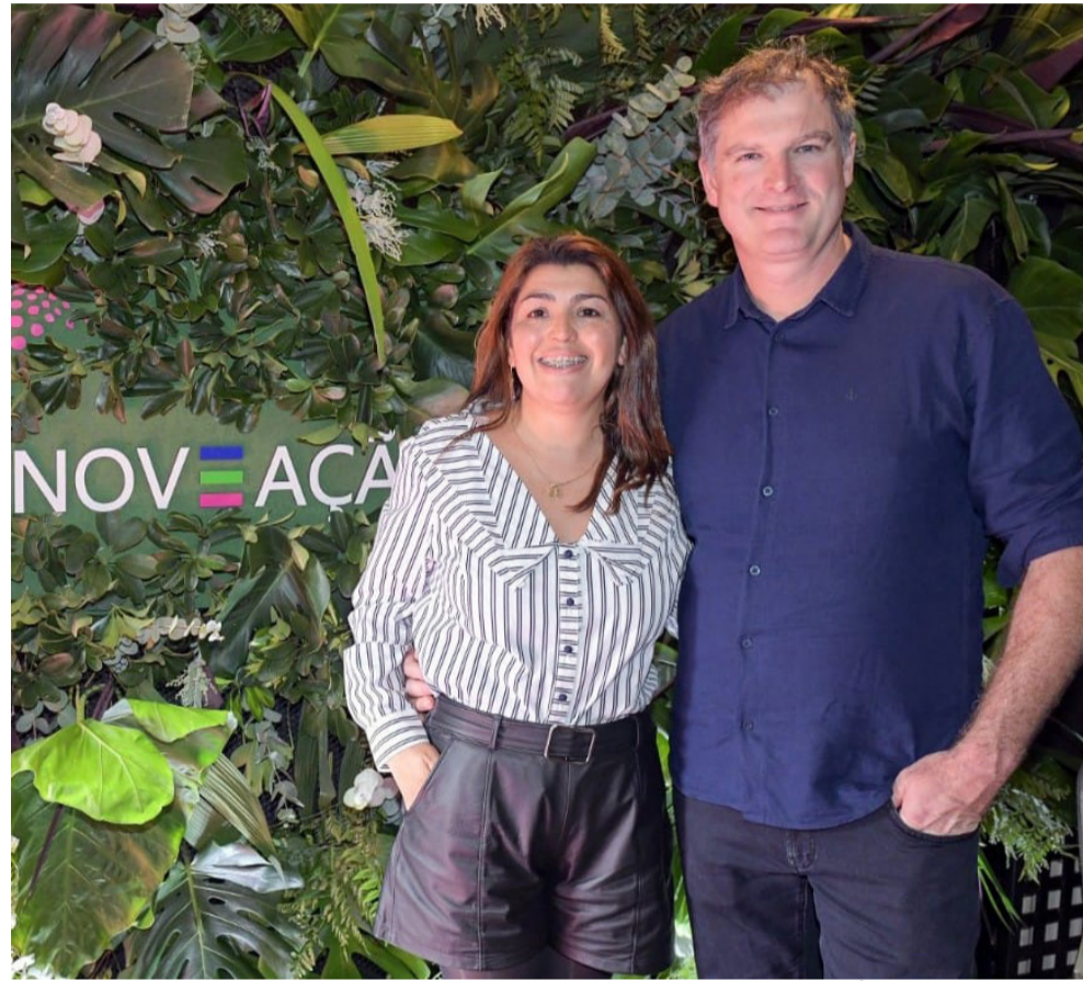
Oficina Keller se fez presente no evento INOVAÇÃO, sobre empreendedorismo, no último dia 24 de junho, em Gramado.