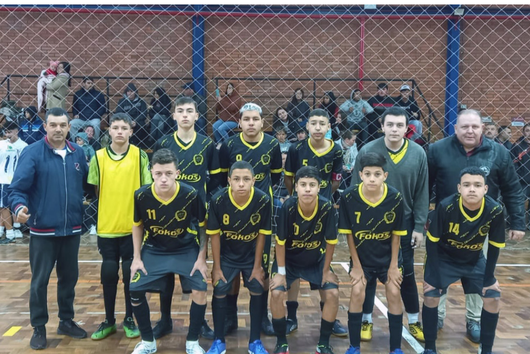
Associação Canelense B