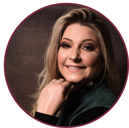
Bethy Schons @bethyschons