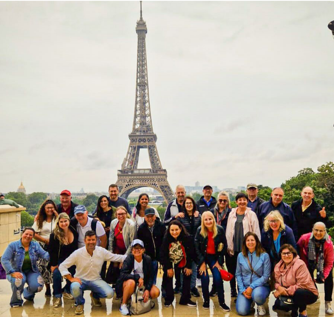
Mais um grupo da Brilho da Serra que esteve viajando pela Europa, visitando Italia, Espanha e França. Na foto o grupo em Paris, na Torre Eiffel.