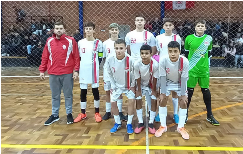
Toque de Letra A

Neste sábado (08), serão disputadas as partidas da repescagem para a semifinal do Campeonato Municipal de Futsal Sub-15 de Canela.