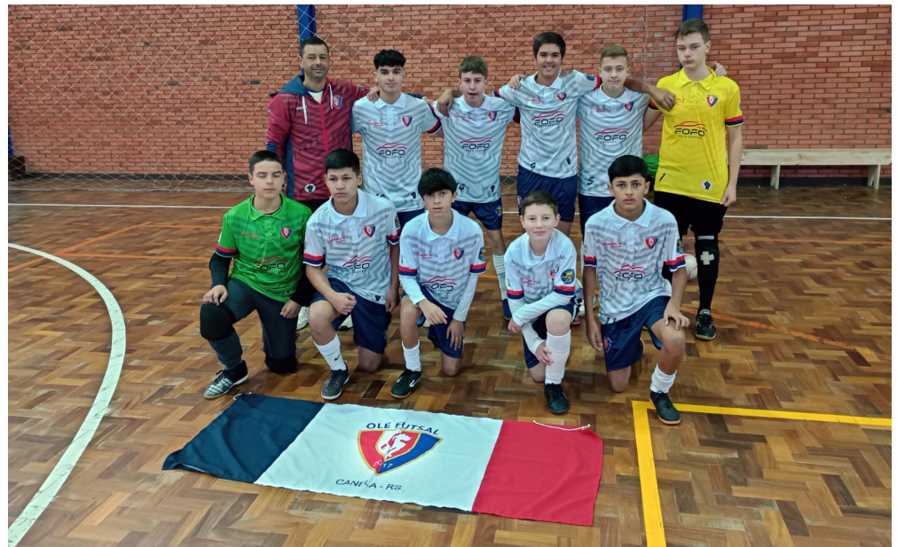
Olé Futsal Branco

Os confrontos serão transmitidos pelo Youtube e Facebook do Portal da Folha, a partir das 14h de sábado (8).