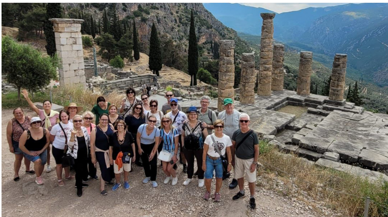
Grupo Destin Turismo Grécia e Ilhas Gregas foi um sucesso, a agência já prepara grandes roteiros para comemorar os seus 10 anos.