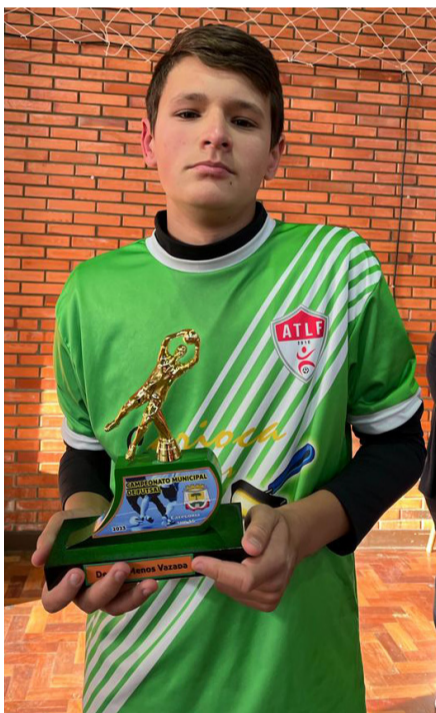
Defesa Menos Vazada: Toque de Letra A