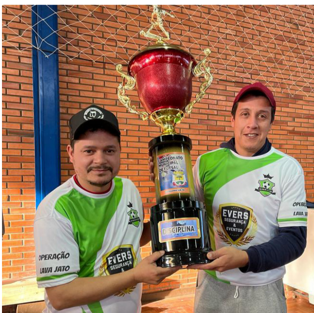
Disciplina - Galera da Estevão