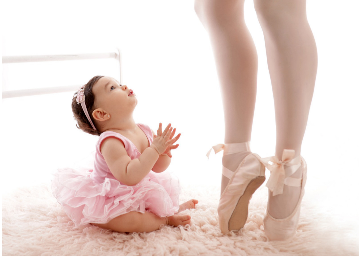
Helena em seus registros de 11 meses.