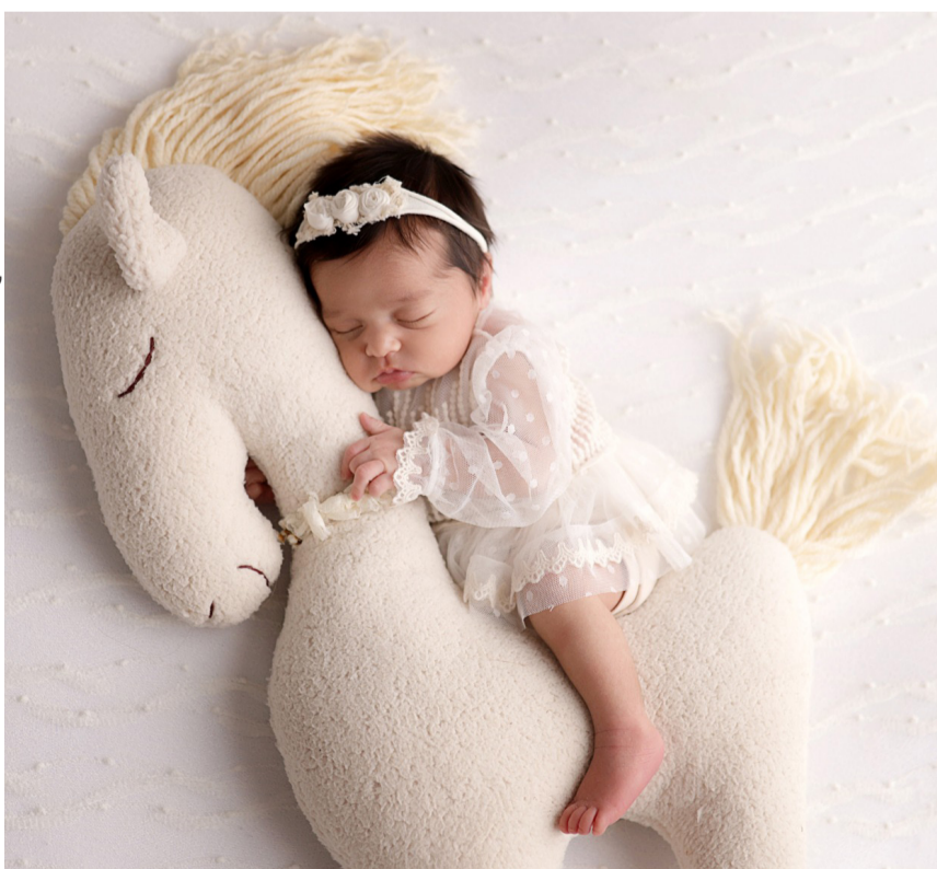
Newborn da Catarina com 20 dias