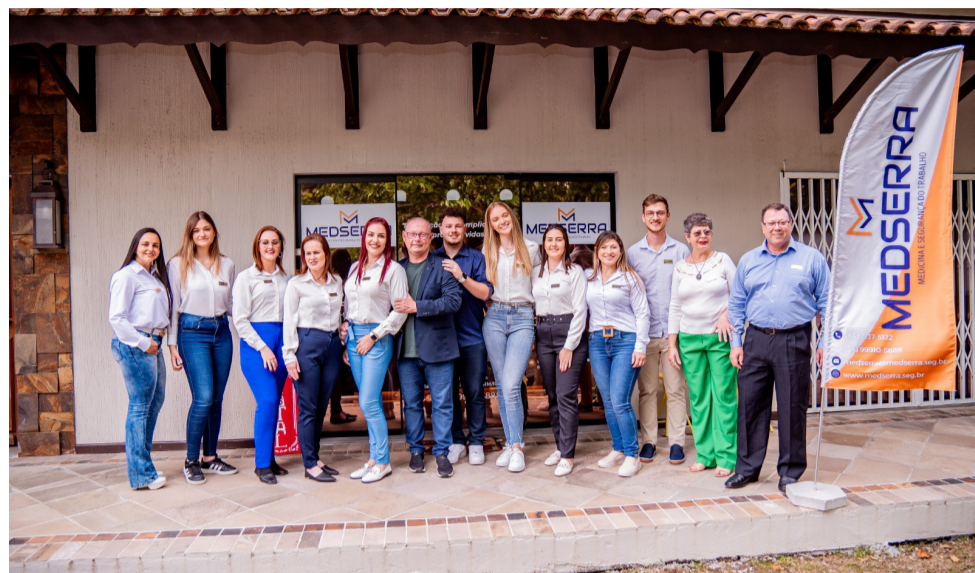
Equipe reunida: Serplamed Feliz, a Matriz, e Medserra

A MEDSERRA se destaca na realização de exames médicos ocupacionais, programas de prevenção de doenças, avaliação de riscos e consultoria em segurança do trabalho. Além disso, a