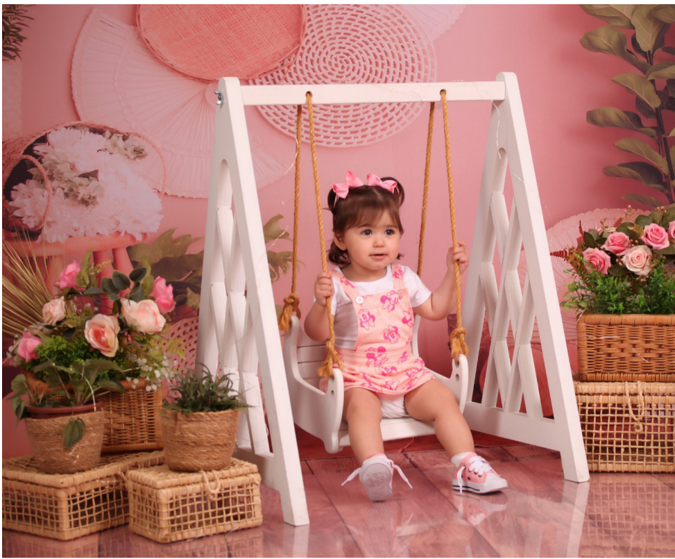
Agatha Sophia modelando para a Canela Foto e Arte.