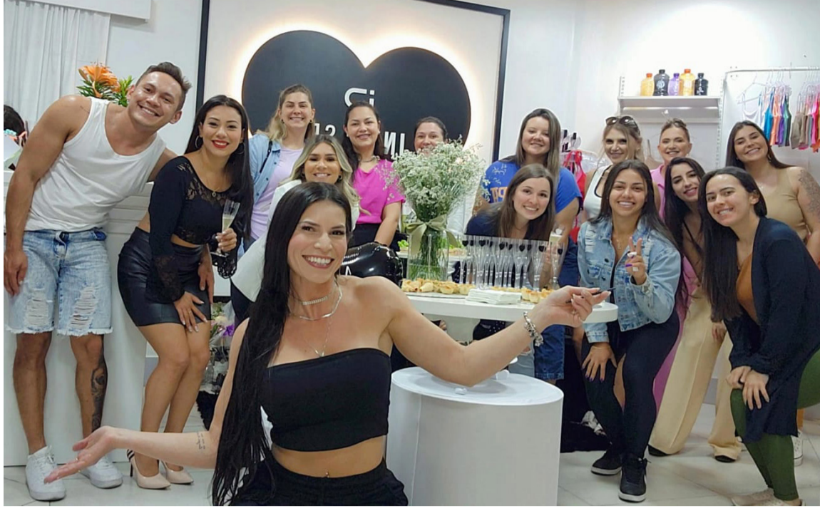
Um ano de loja física da Inpulse Fitness, comemorado com muita alegria com clientes e amigos