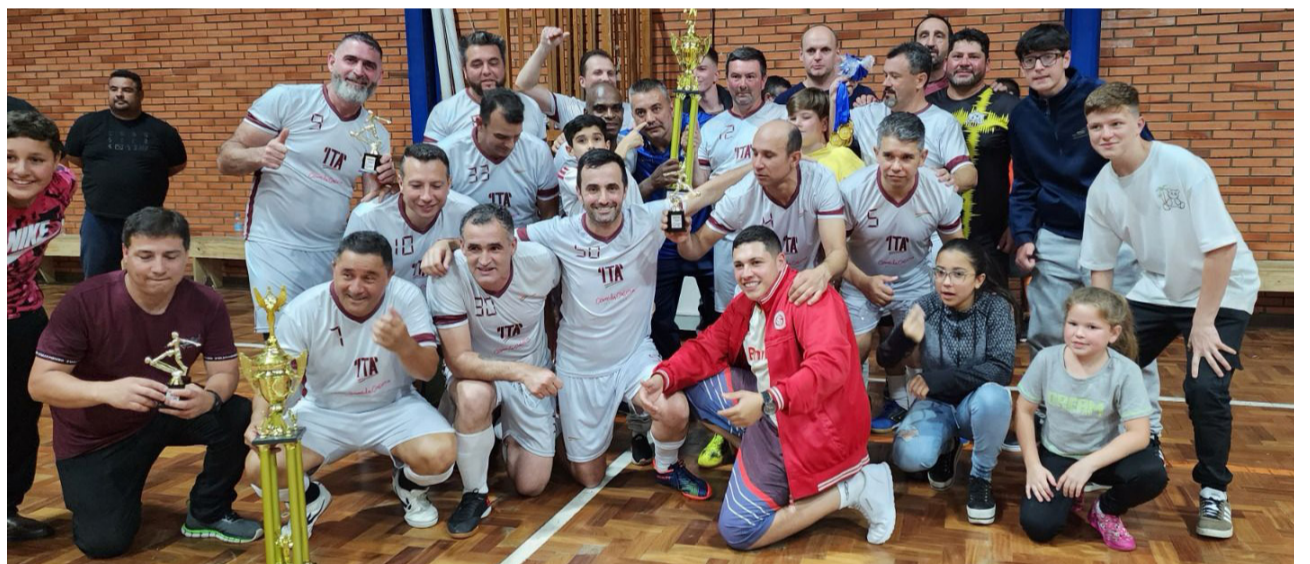
Equipe do Amigos FC