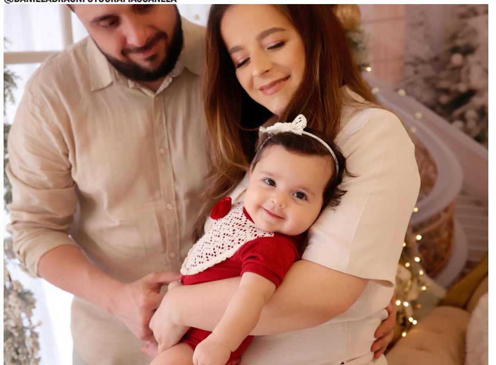
O ensaio de Natal da família da Catarina!