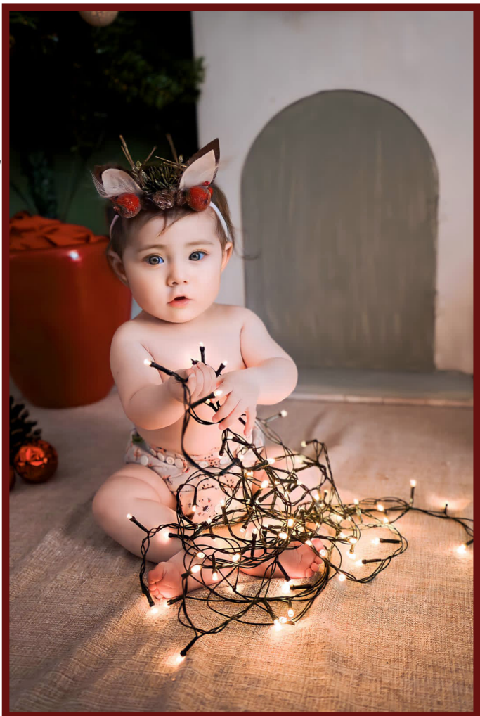
Ísis transbordando a magia do Natal!