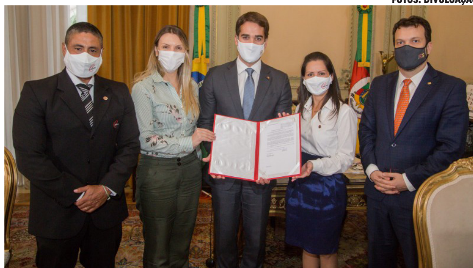
Governador Eduardo Leite sanciona a Lei 15.603/2021, criada com a colaboração do CREF2/RS

Nos últimos anos, o CREF2/RS participou ativamente da elaboração de protocolos para o funcionamento das academias durante a pandemia e buscou o apoio do Governo Estadual – e de diversas Prefeituras – para que leis que tornam a Educação Física um serviço básico fossem aprovadas. Hoje 290 dos 497 municípios do Rio Grande do Sul (58%) protocolaram um projeto de lei com esse intuito e o Governador sancionou em 2021 a